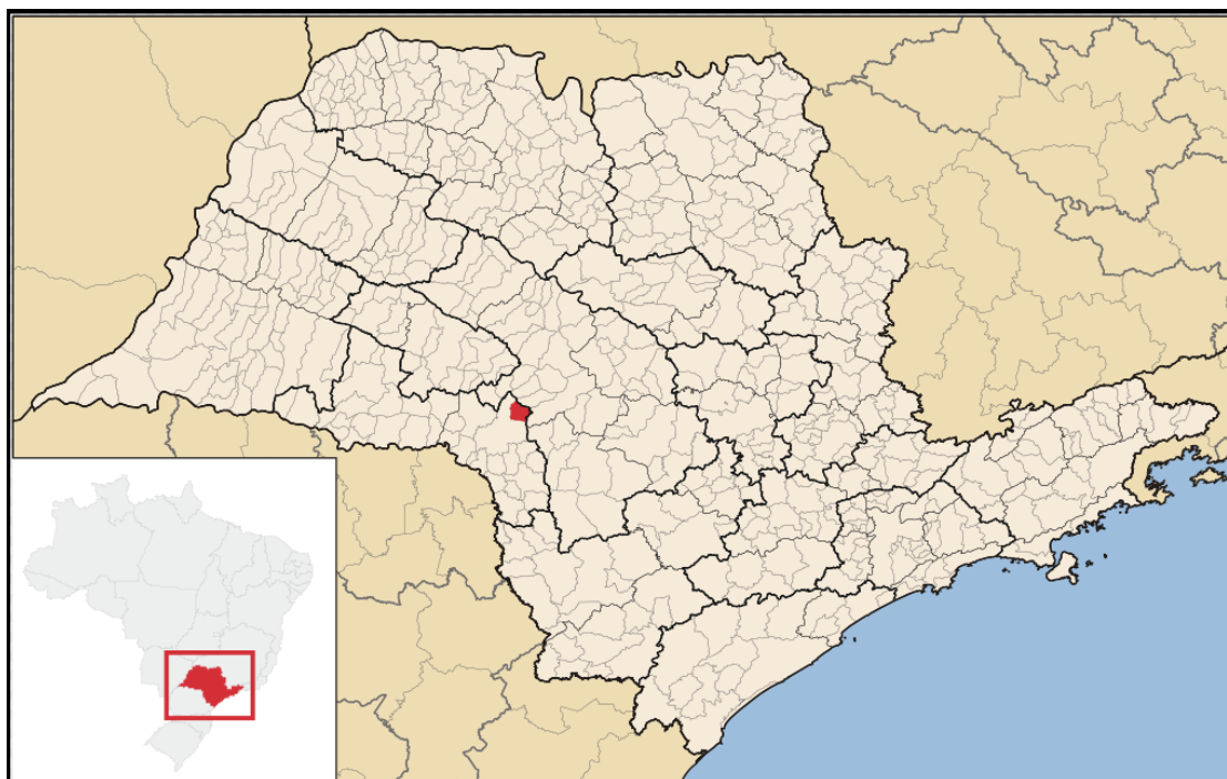
Figura 1 – Localização do município de Espírito Santo do Turvo

Segundo o estudo do SEADE "Projeção da População e dos Domicílios para os municípios do Estado de São Paulo: 2010-2050", as estimativas para o município, em 2017, foram: