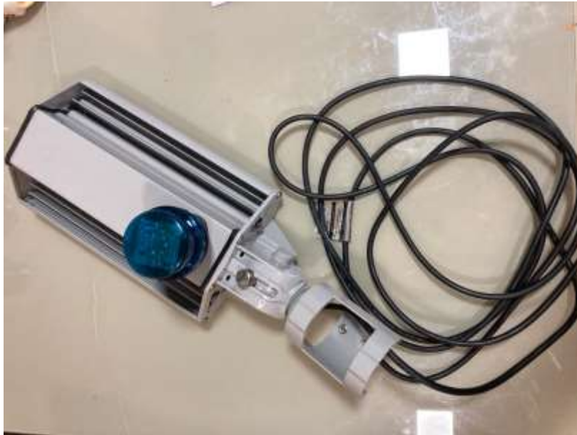
Figura 7 – CABO DE ALIMENTAÇÃO

Rua Lino dos Santos, s/nº - Jardim Canaã - Fones (14) 3375-9500 - CEP 18935-000 CNPJ/MF 57.264.509/0001-69