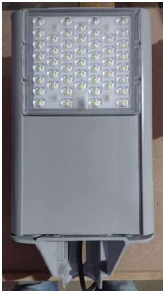
Figura 3 - Lente