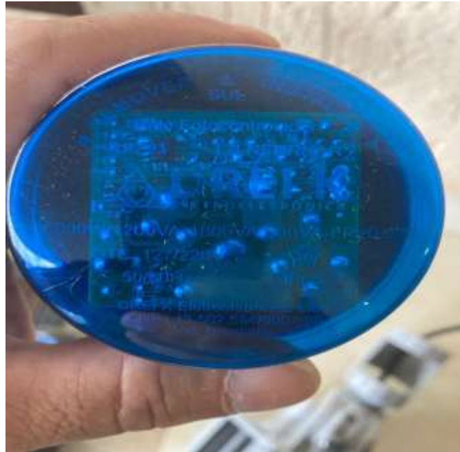
Figura 12 - Relé Fotoeletrônico

Rua Lino dos Santos, s/nº - Jardim Canaã - Fones (14) 3375-9500 - CEP 18935-000 CNPJ/MF 57.264.509/0001-69