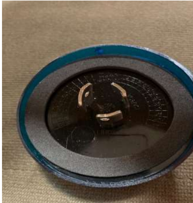
Figura 11 - Relé Fotoeletrônico