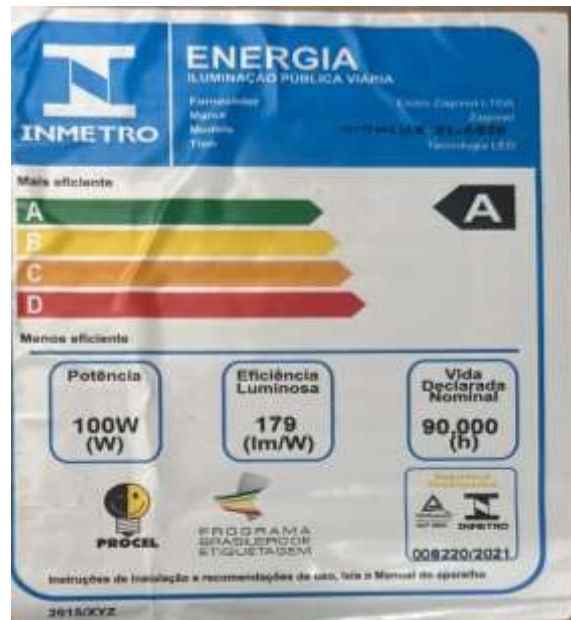
Figura 6 - Etiqueta INMETRO