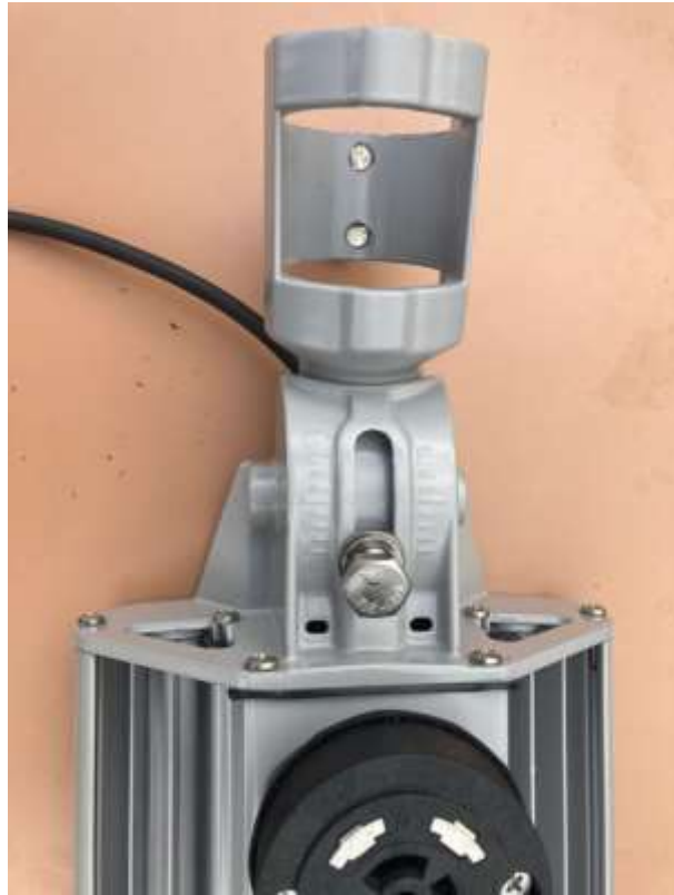
Figura 4 - Suporte com regulagem de ângulo

Rua Lino dos Santos, s/nº - Jardim Canaã - Fones (14) 3375-9500 - CEP 18935-000 CNPJ/MF 57.264.509/0001-69