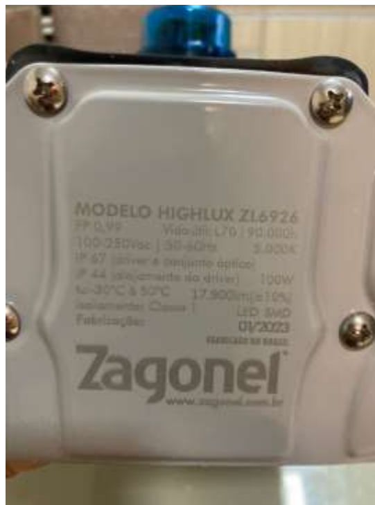
Figura 1 - Especificações do modelo