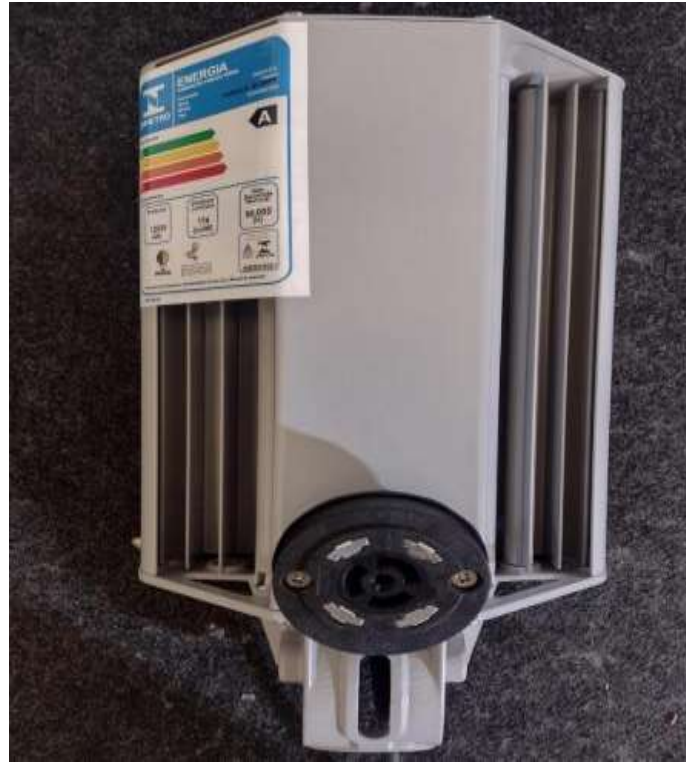
Figura 5 - Base para Relé

Rua Lino dos Santos, s/nº - Jardim Canaã - Fones (14) 3375-9500 - CEP 18935-000 CNPJ/MF 57.264.509/0001-69