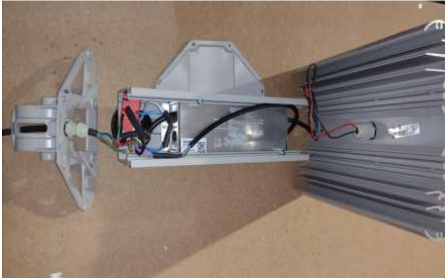
Figura 2 – Driver / DPS

Rua Lino dos Santos, s/nº - Jardim Canaã - Fones (14) 3375-9500 - CEP 18935-000 CNPJ/MF 57.264.509/0001-69