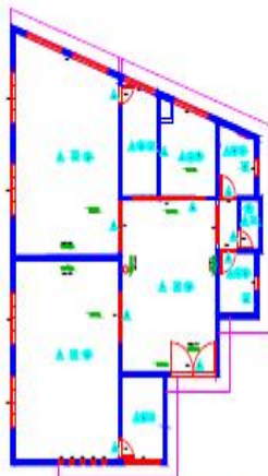
Especificação dos Revestimentos e Incêndio