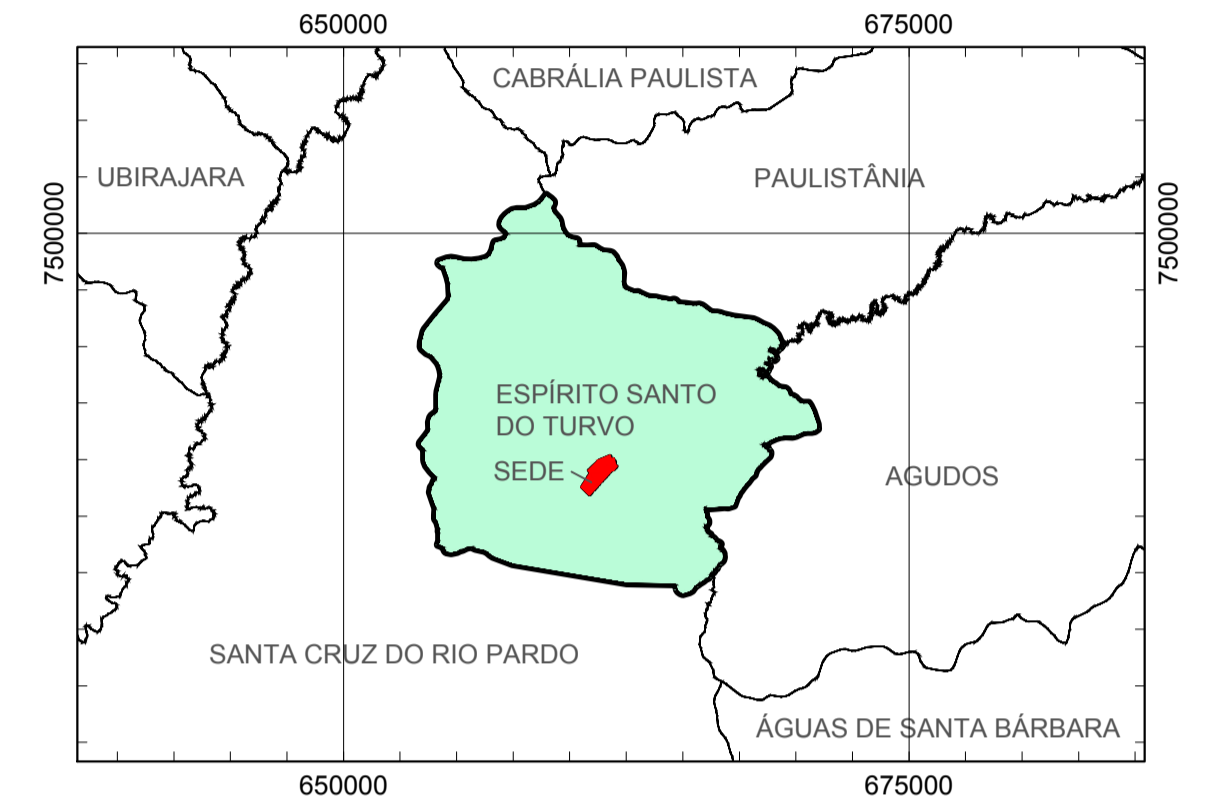
ÁREA DE ESTUDO