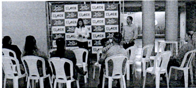
Ganhadores da Promoção de Dia das Mães compareceram na ACE para receber os prêmios

Esta foi a primeira promoção da ACE Santa Cruz realizada de forma digital. As lojas participantes entregaram as seladlinhas e os clientes deveri-