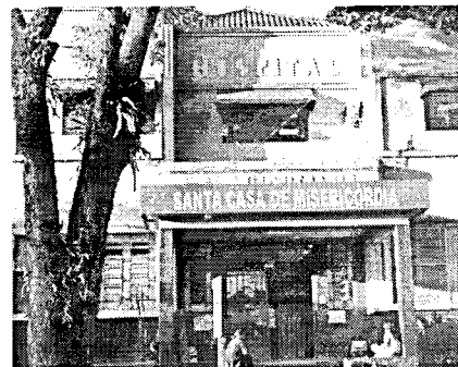
Santa Casa receberá porcentagem de venda de ingressos

O show de Renato Teixeira, Um Poeta e Um Violão, além de trazer música de qualidade para o público será solidário em prol da Santa Casa de Misericórdia de Santa Cruz do Rio Pardo. A cada ingresso uma porcentagem será revertida para o hospital.