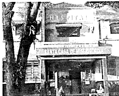
Santa Casa receberá porcentagem de venda de ingressos

O show de Renato Teixeira, Um Poeta e Um Violão, além de trazer música de qualidade para o público será solidário em prol da Santa Casa de Misericórdia de Santa Cruz do Rio Pardo. A cada ingresso uma porcentagem será revertida para o hospital.