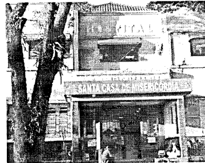
Santa Casa receberá porcentagem de venda de ingressos

O show de Renato Teixeira, Um Poeta e Um Violão, além de trazer música de qualidade para o público será solidário em prol da Santa Casa de Misericórdia de Santa Cruz do Rio Pardo. A cada ingresso uma porcentagem será revertida para o hospital.