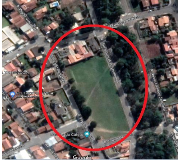
Figura 17 - Localização da quadra 20

Região provida de pavimentação asfáltica, rede elétrica pública e domiciliar, telefone, água e esgoto.