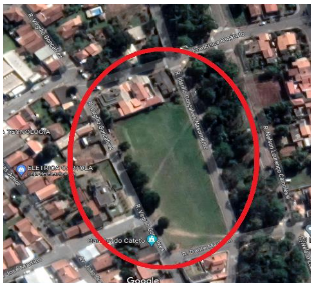
Figura 13 - Localização da quadra 20

ESTADO DE SÃO PAULO Rua Lino dos Santos, s/nº - Jardim Canaã - Fones (14) 3375-9500 – CEP 18935-000 CNPJ/MF 57.264.509/0001-69