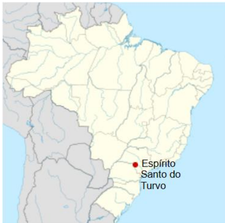
LOCALIZAÇÃO DO MUNICÍPIO NO MAPA DO BRASIL