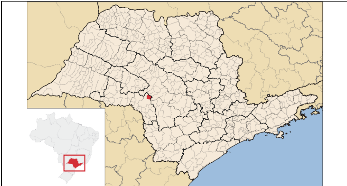
LOCALIZAÇÃO DO MUNICÍPIO NO ESTADO DE SÃO PAULO

Na análise do uso do solo, uma das principais categorias a ser analisada é a divisão do território em zonas urbanas e zonas rurais.