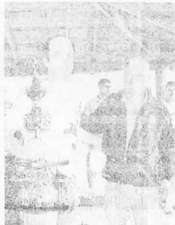
São Pedro Maneiro