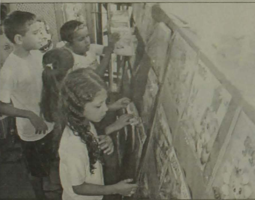
As crianças ficaram bastante interessadas pelos livros

Os exemplares prenderam a atenção dos leitores. Entre outros exemplos são obras literárias brasileiras, como O triste fim de Poli-