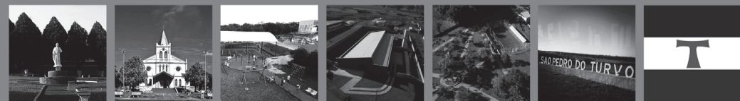
Esta Programação será transmitida através da Página Oficial da Prefeitura Municipal de São Pedro do Turvo no Facebook.