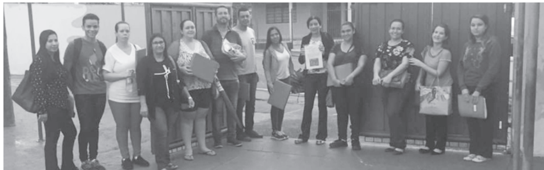
Para não comprometer o aprendizado, o material foi levado aos alunos pelos monitores

Turvo, fizeram a rota da zona rural, desta vez, não para buscar alunos, mas para levar o material de estudo para cada criança desde o pré até o 5º Ano do Ensino