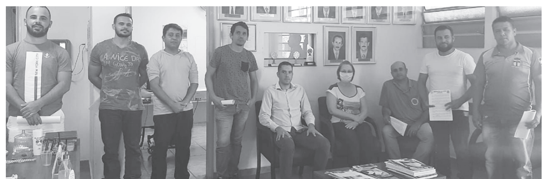
Membros do Comitê Municipal de Prevenção à propagação do Covid-19, Comissão de Fiscalização e Polícia Militar também foram recebidos pelo prefeito e vice-prefeita

Polícia Militar, no dia 06 de abril, no prédio da Prefeitura Municipal para decisão de novas medidas de prevenção a propagação do Covid-19 para os próximos dias. “Vamos juntos enfrentar essa guerra contra esse malfadado vírus”, completou o prefeito.