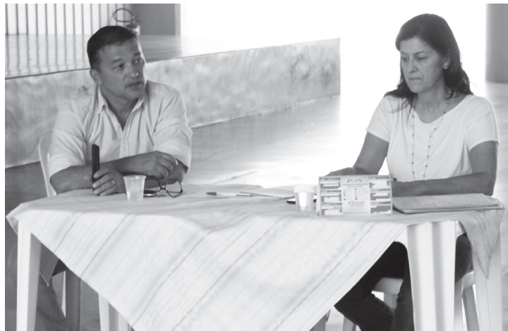
Direção da ACE orienta empresários a manter criatividade e responsabilidade para proteção da vida

Devem seguir funcionando durante a quarentena: hospitais, clínicas, farmácias e clínicas odontológicas; transporte público; transportadoras e armazéns; empresas de telemarketing; petshops; deliveries; supermercados, mercados e padarias; limpeza pública; postos de combustível.