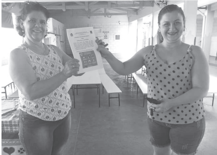
As apostilas foram entregues aos pais e/ou alunos

Na terça-feira, 07 de abril, às 7h da manhã, os motoristas e monitores do transporte escolar de São Pedro do