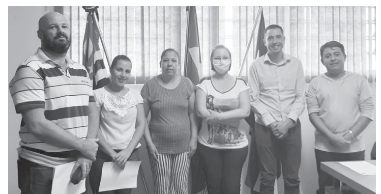
Representantes do comércio foram recebidos na prefeitura

inho, os comerciantes estão conscientes de que é um momento atípico e de prevenção.