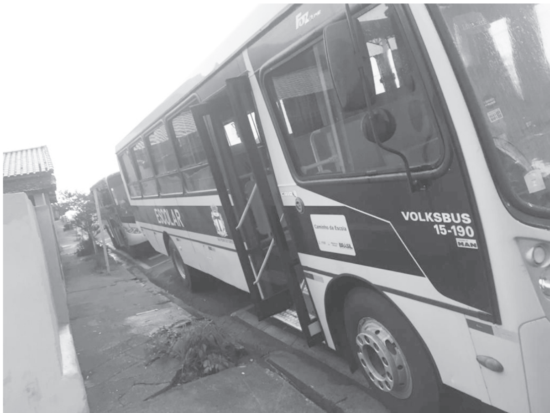
A frota da Educação foi disponibilizada para percorrer o trecho rural

tir prejudicado na compra de produtos, que apresentem abusividade nos preços, solicitamos a gentileza de abrir uma reclamação enviando seus dados como nome e telefone com cópia da nota fiscal ou cupom fiscal para o email: procon@santacruzoriopardo.sp.gov.br ou ainda você pode fazer sua reclamação online através do site: consumidor.gov.br ou ainda ligar para o telefone: (14) 3332-1019. No caso de não ter acesso à internet e não conseguir efetuar as reclamações através dos meios digitais, eliminando as possibilidades de sucesso no acesso; o consumidor poderá realizar agendamento de horário (este definido pelo Procon) através do telefone: 3332-1019. O agendamento será registrado no sistema do Órgão Administrativo e repassado para o consumidor.