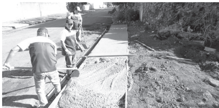
Funcionários da Secretaria de Obras já utilizando os uniformes

A entrega começou pelos funcionários da Secretaria de Obras e Planejamento Urbano e Secretaria de Agricultura e Meio Ambiente.