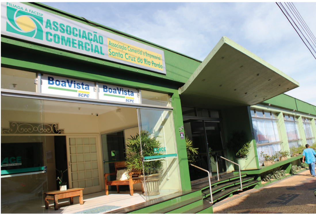
ACE é uma autoridade de registro autorizada junto a Certisign para validação e emissão do certificado

Em função do Decreto Estadual contra a propagação do COVID-19 (coronavírus), a agenda de validação do certificado digital está fechada no sistema até o dia 7 de abril, ou até que sejam divulgadas novas orientações. O sistema de compra permanece normal. Para urgências referentes a validação, o empresário e ou escritórios de contabilidade devem entrar em contato no telefone (14) 99852-2165.