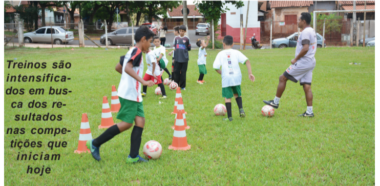
Treinos são intensificados em busca dos resultados nas competições que iniciam hoje

Este final de semana será intenso para as equipes do CAS (Clube Atlético Santacruzense).