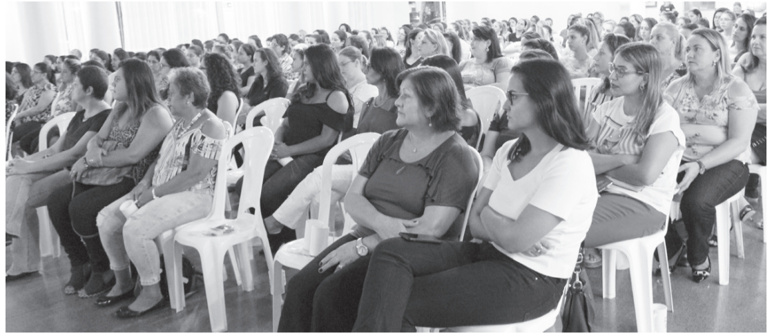
Público no Happy Hour do ano passado