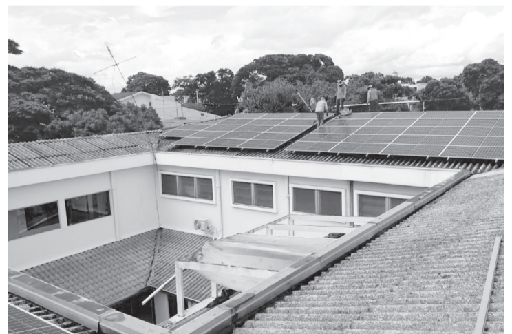
Painéis de energia fotovoltaica instalados na Santa Casa

Destá forma a Santa Casa conta com uma usina de energia fotovoltaica, cujos cálculos técnicos apontam para uma produção inicial de 50% do consumo de energia