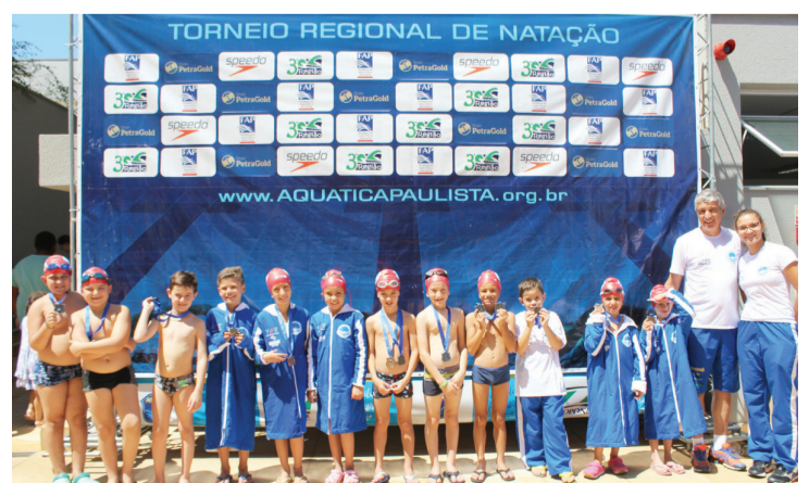
Atletas na última competição de 2019, em Bauru

O recurso é utilizado para oferecer gratuitamente treinamento, equipamentos e infraestrutura técnica esportiva necessária para o desenvolvimento e aperfeiçoamento dos nadadores. A equipe já conta com uma trajetória, anterior ao projeto, de 14 anos, vinculada à Afan (Associação de Formação de Atletas de Natação de Santa Cruz do Rio Pardo).