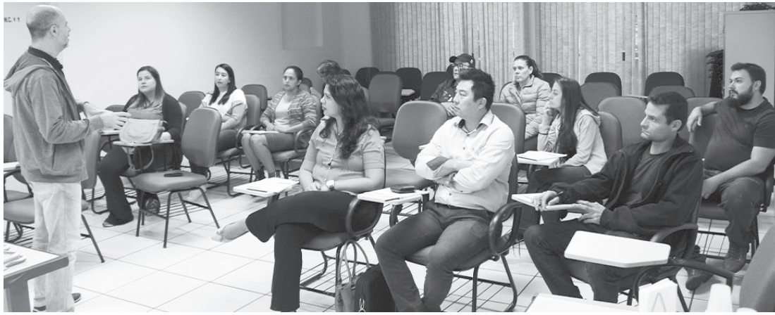
Oficina Super MEI realizada no ano passado na ACE

As aulas serão na sala de treinamento da ACE das 19