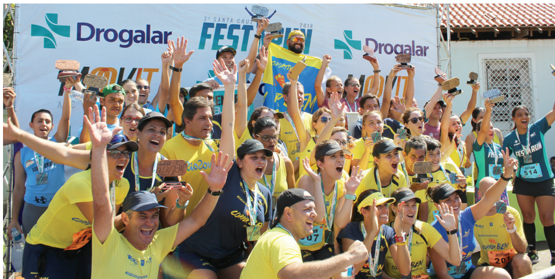
Equipe faz festa na Fest Run realizada no ano passado, no dia do aniversário da cidade

A largada acontece as 8 horas, na praça São Sebastião, em frente a atual sede da Secretaria Municipal da Saúde, antiga