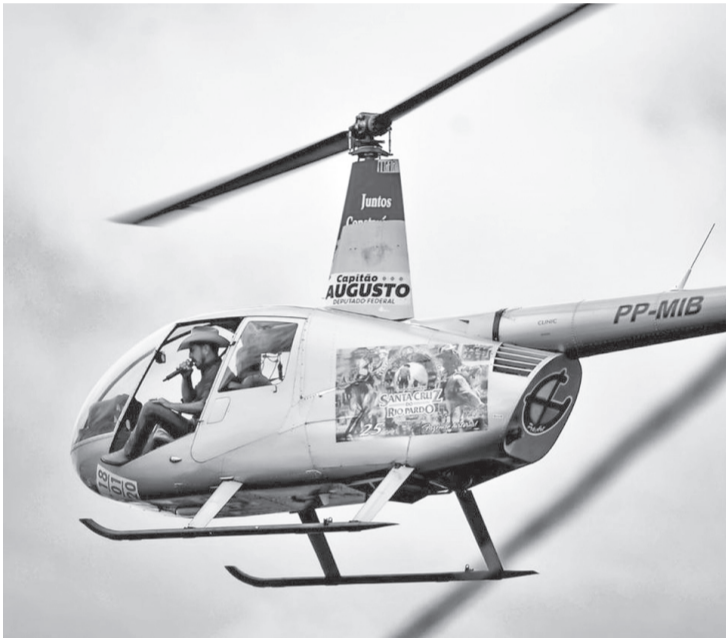
A divulgação da festa aconteceu durante a semana