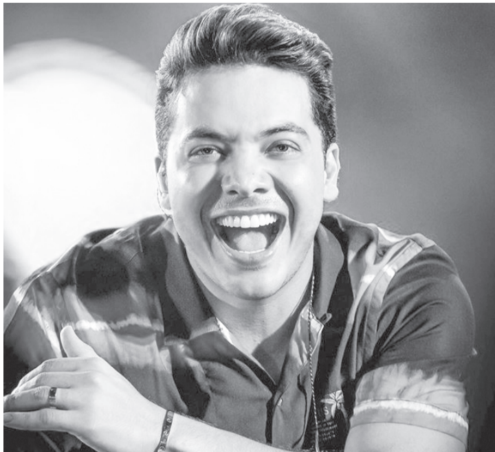
Na quinta-feira quem sobe aos palcos é Wesley Safadão