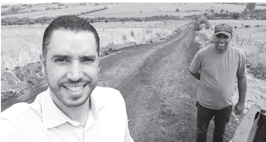
A atual gestão pretende entregar 80% das estradas rurais recuperadas