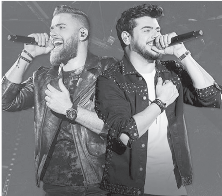
Único show pago será de Zé Neto e Cristiano