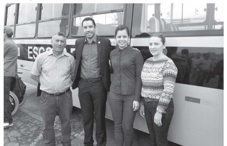
A Educação sempre teve um olhar especial da administração e recebeu um choque de gestão, assim como a conquista de 6 novos ônibus escolares, média de 2 ônibus conquistados por ano