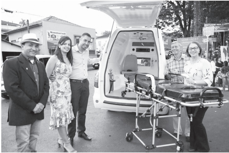
Dois ambulâncias foram conquistados

PREFEITO: Sempre quando entra essa fase de final de ano, dezembro, janeiro e até fevereiro, com as fortes chuvas, pancadas de chuva, isso acaba que danificando as estradas e as cobranças são muito maiores. O município de São Pedro do Turvo tem quase 800 km de estradas rurais. Existem linhas de transporte escolar em que o motorista tem que acordar 3h30, são mais de 100 km ida e volta além de ir parando, então imagina o transtorno e a dificuldade de manter essa quantidade de km de estrada. Nós assumimos e é notório, as estradas estavam abandonadas, é triste falar isso mas é uma realidade. Na época o fiscal deixou a desejar com relação a recuperação das vias e nós entramos com esse compromisso. Fechando o ano de 2019 já conseguimos recuperar 65% das estradas rurais e hoje é uma nova realidade. Lógico que tem muito o que fazer ainda, muito trabalho, vamos ainda trabalhar forte principalmente na estrada das Três Barras que sai na BR 153, essa é nossa grande pri-