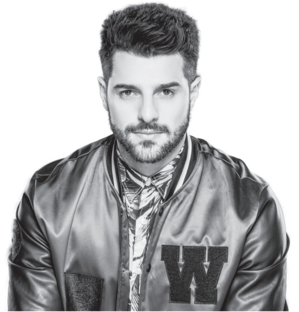
O Dj Alok encerra com chave de ouro a maior de todas