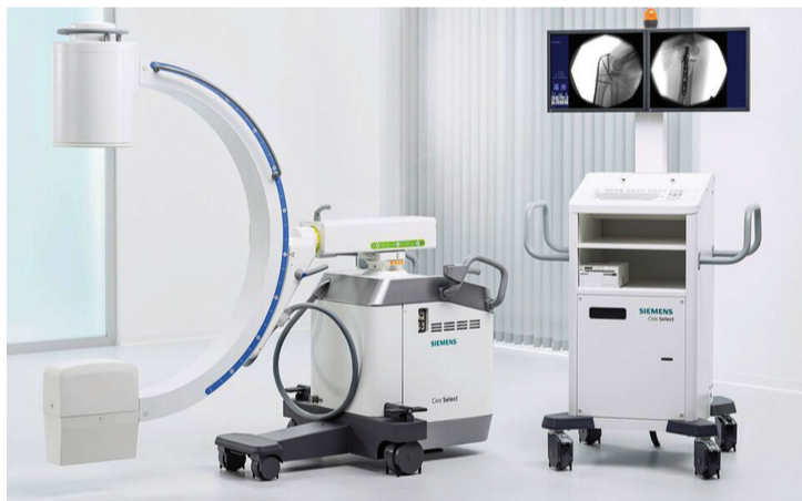
Arco cirúrgico deve ser instalado nos próximos dias

A Santa Casa já conta com um arco cirúrgico, mas por ser antigo exige manutenção frequente, o que gera contínuos gastos. A instalação deverá ser realizada por equipe técnica da empresa fornecedora nos próximos dias e será alocado em nova sala edificada na reforma do Centro Cirúrgico, oportunidade em que será realizada a capacitação para o manuseio correto do equipamento.