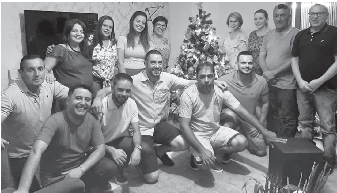
Parte da equipe de secretários e diretores da administração atual