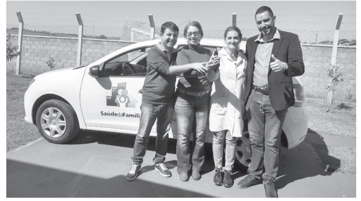
Assim como veículos para os ESFs

PREFEITO: Todas são prioridades, mas eu tenho uma preocupação muito grande com a Educação. Eu não posso esconder isso porque a