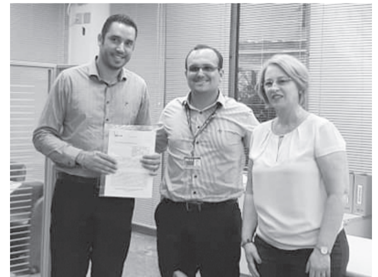
...na última segunda-feira na agência da Caixa

Rodovia Francisco Alves Negrão, SP 258, km 285 - Bairro Pilão D'Água - Itapeva (15) 99806 3557 | 99806 3563 | vestibular@fait.edu.br