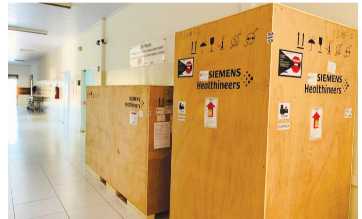
Modelo Cios Select da marca Siemens Healthineers é considerado um equipamento de última geração