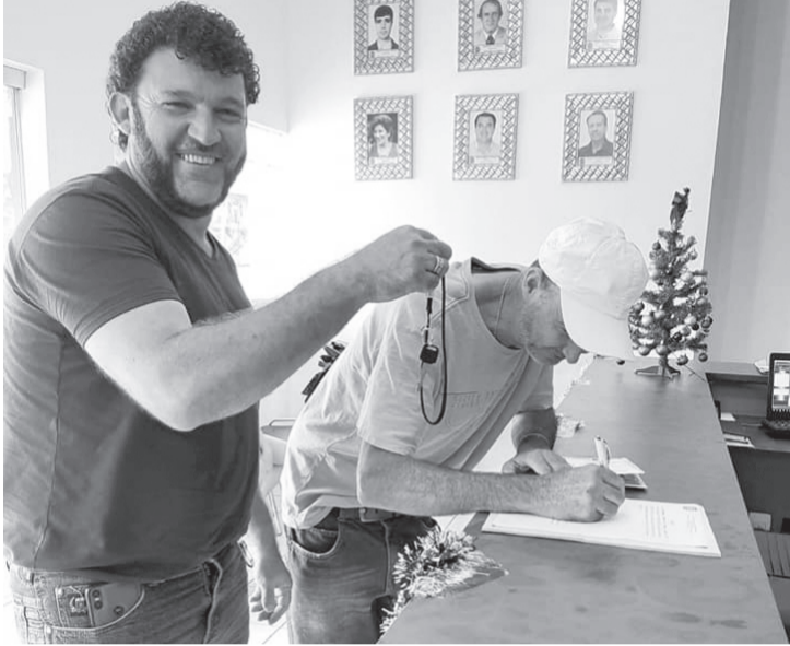
Lauder fez a entrega da moto ao ganhador