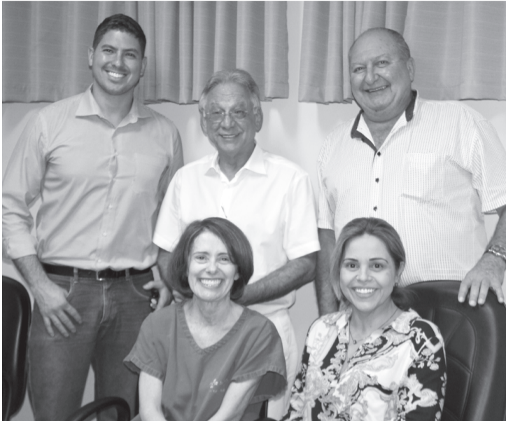
Equipe de ginecologia e obstetrícia da Santa Casa