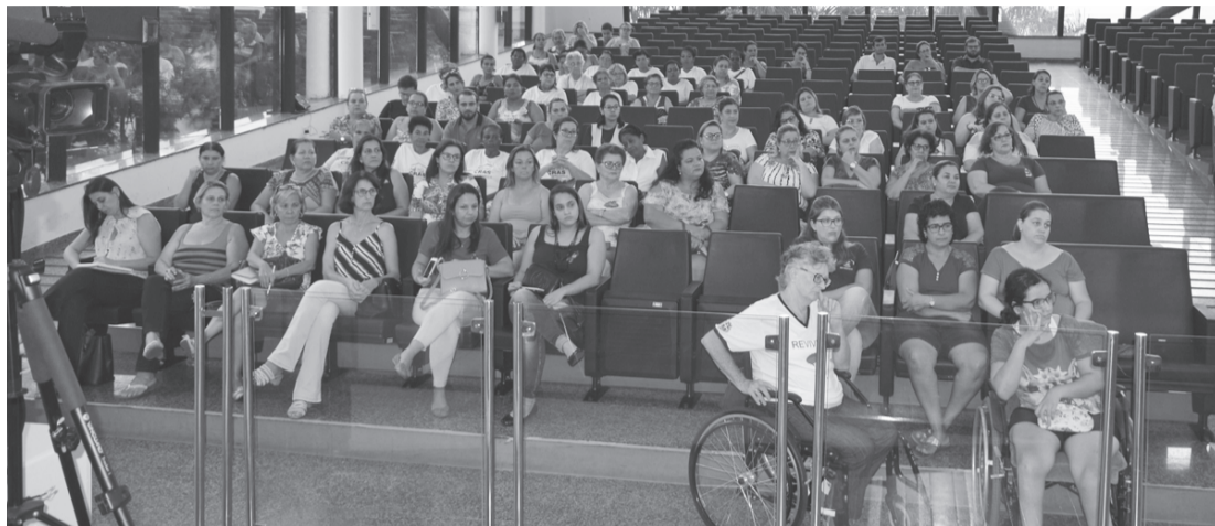
Público presente no evento

la e com um depoimento emocionante, falou do bullying que sofria na escola e de seu amor por sua família.