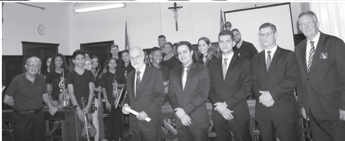
Membros da Orquestra com as autoridades presentes no evento

A Orquestra executou as seguintes canções: 'Hino a Alegria'; 'Asa branca'; 'Como é grande meu amor', 'Dona Maria', 'Michelle', 'Do, re, mi' e 'Danúbio Azul'.