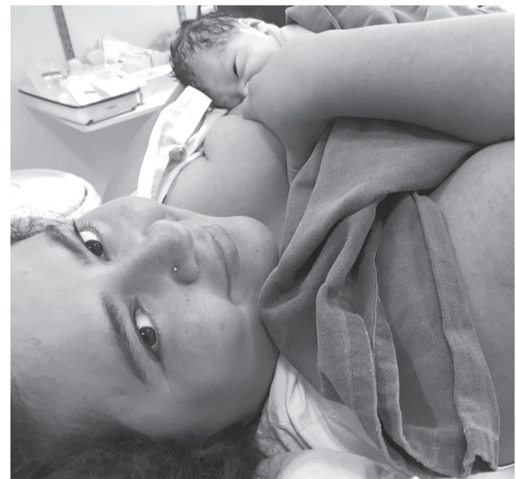
Contato pele a pele é realizado na maternidade da Santa Casa

“Estamos em um processo de construção e melhorias, confiamos que iremos avançar pouco a pouco na realização completa de um parto humanizado”, disse a enfermeira obstetra da maternida-