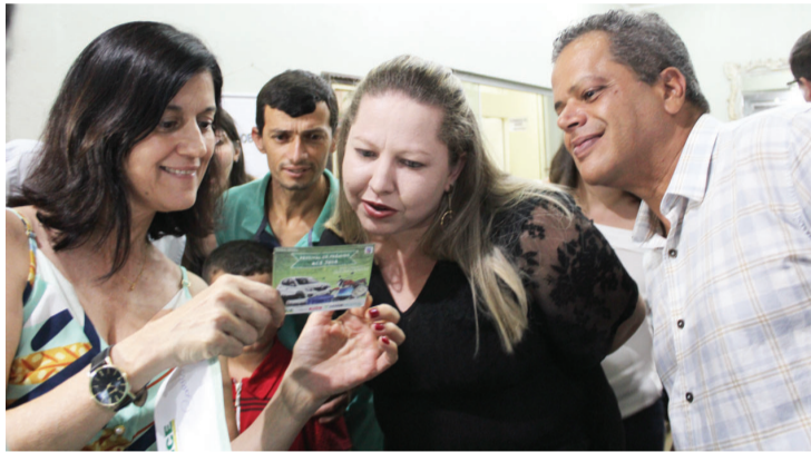
Audidores conferem o cupom do ganhador do carro

A entrega oficial de todos os prêmios aconteceu na segunda-feira (31 de dezembro) às 10 horas, na ACE.