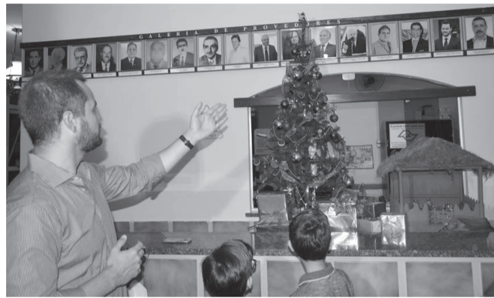
SANTA CRUZ DO RIO PARDO

Provedores, na Santa Casa de Misericórdia de Ipaussu. Na ocasião, também foi inaugurada a nova lavanderia da Santa Casa, reformada pela atual gestão, após 60 anos.