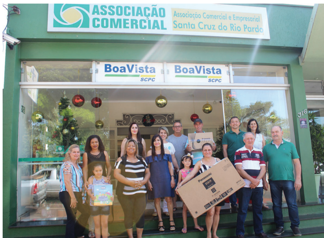
Ganhadores do sorteio em frente a ACE