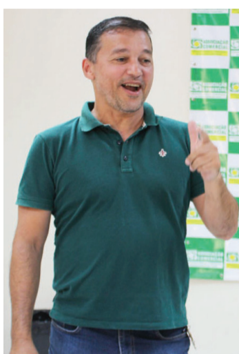
Presidente Artur discursando durante entrega dos prêmios