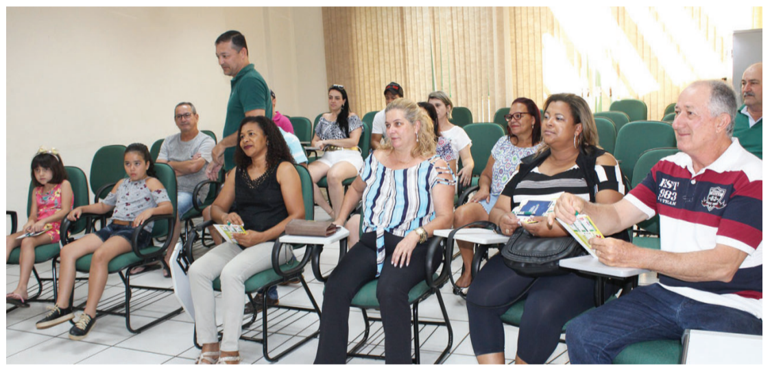
Ganhadores e empresários reunidos na Sala de Treinamento da ACE