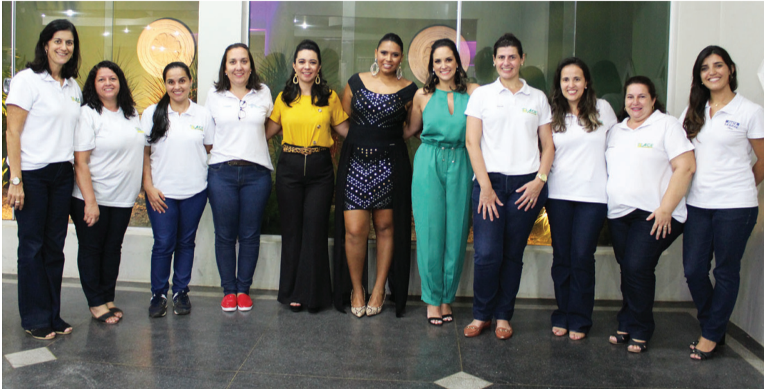
Leia matéria completa nesta edição. Na foto: Colaboradoras da ACE e convidadas