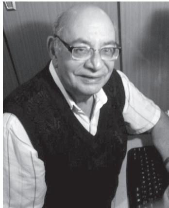
Poeta Geraldo Peres Generoso