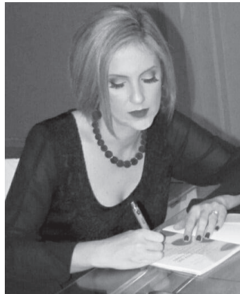
Poeta Vita Palugan

No último dia 14 de março foi comemorado o dia da Poesia no Brasil, por ocasião do aniversário de Castro Alves. A poesia tem ganhado cada dia mais espaço em meio a este mundo tão agitado. Sim, embora muitos acreditem que não tem surgido inúmeros poetas, autores de um caráter incrível.