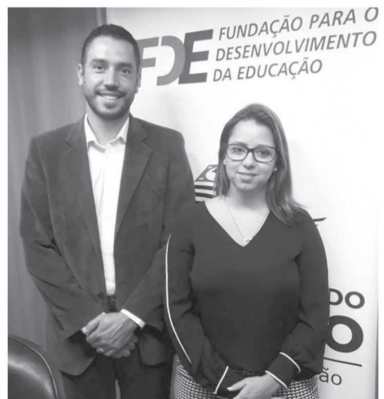
O prefeito também esteve no FDE

Habitacional e Urbano) enviará um técnico para analisar a viabilidade e após, precisará da autorização do Legislativo para tal aquisição.