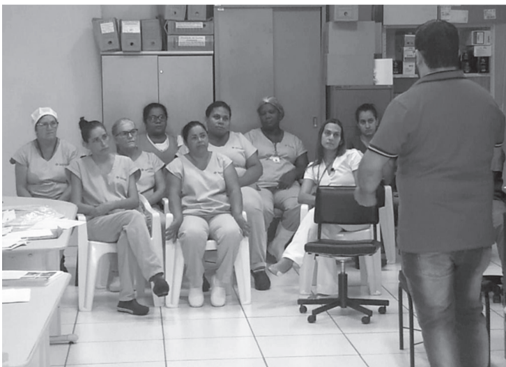
Ergonomia foi o assunto destacado durante as palestras

No dia 19 de fevereiro, o assunto foi ergonomia voltado para os colaboradores da Higiene, Manutenção e Lavanderia e Cozinha. Já no dia 21, o mesmo tema foi voltado aos profissionais do