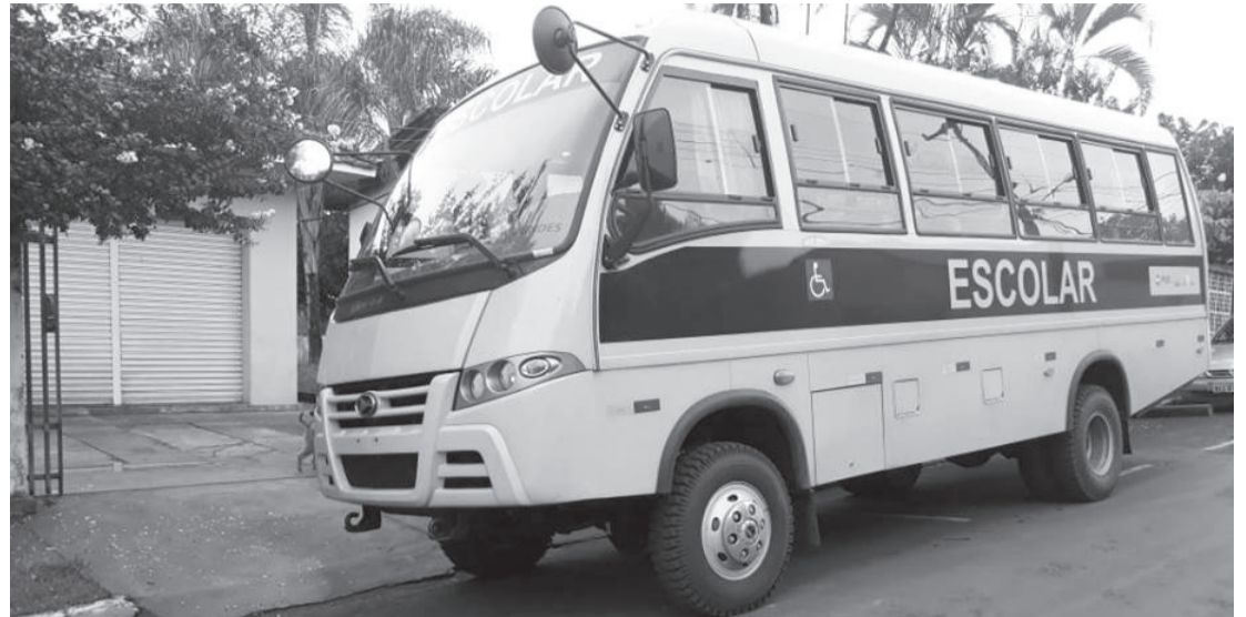
O ônibus 0km chegou na quinta-feira no município

Em parceria com a Caixa Federal, a administração está estudando três áreas nas adjacências do município para aquisição do terreno porém, a CDHU (Companhia de Desenvolvimento