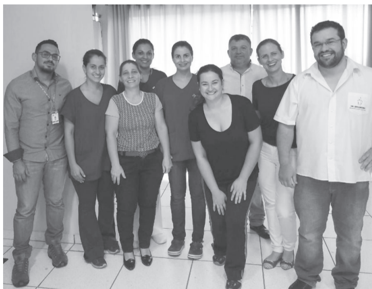
Colaboradores participaram de palestra promovida na Santa Casa