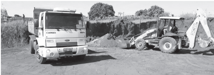
SANTA CRUZ DO RIO PARDO