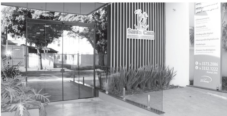
SDI ganhou novo espaço no último ano

O SDI além dos equipamentos modernos, conta com uma equipe técnica responsável e experiente prontos para atender de forma humana e personalizada, não sendo mais necessário o deslocamento para outras cidades da região para realizar estes exames.