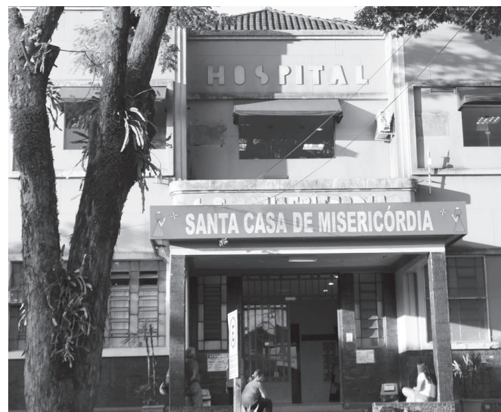
Santa Casa receberá porcentagem de venda de ingressos

O show de Renato Teixeira, Um Poeta e Um Violão, além de trazer música de qualidade para o público será solidário em prol da Santa Casa de Misericórdia de Santa Cruz do Rio Pardo. A cada ingresso uma porcentagem será revertida para o hospital.