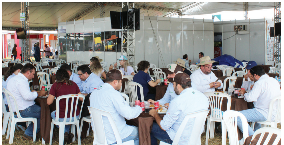
Valor arrecadado com a venda de almoço foi revertida ao hospital

janeiro. A renda do almoço vendido aos produtores presentes será repassada ao hospital. No total, a equipe de colaboradores da Santa Casa, que trabalhou no evento, vendeu mais de 800 refeições. O