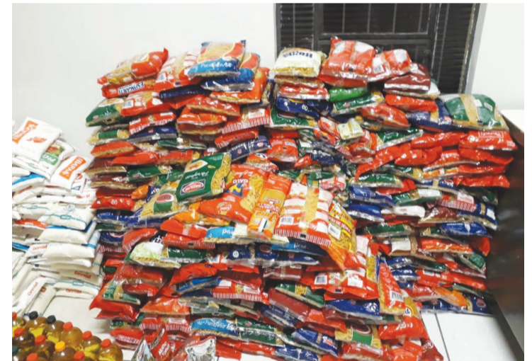
Parte do alimento arrecadado durante uma noite da Festa do Peão

Na última semana dois eventos movimentaram Santa Cruz do Rio Pardo, Agro Ferrari no Campo e a Festa de Peão de Boiadeiro.