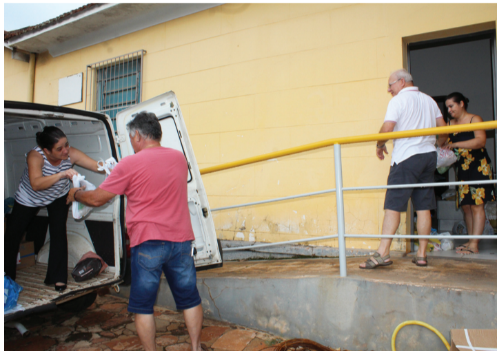
Voluntários descarregam alimentos arrecadados para a Santa Casa