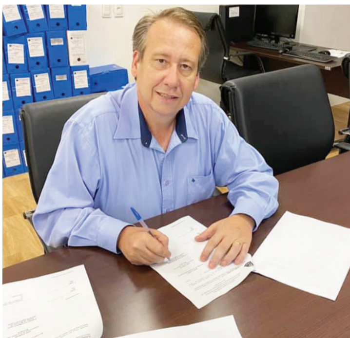
Prefeito Afonso durante assinatura do convênio

“São Paulo termina seu primeiro ano de governo sem dívidas, pagando seus fornecedores em dia e antecipando R$ 1,1 bi em ICMS para que prefeitos e prefeitas também pudessem atender demandas municipais. Prometemos e cumprimos o objetivo de ser um governo municipalista. Não fazemos gestão partidária ou ideológica, todos os municípios são iguais. Temos uma única nação, a dos brasileiros de São Paulo”, disse Doria a uma plateia de cerca de 1,5 mil pessoas.