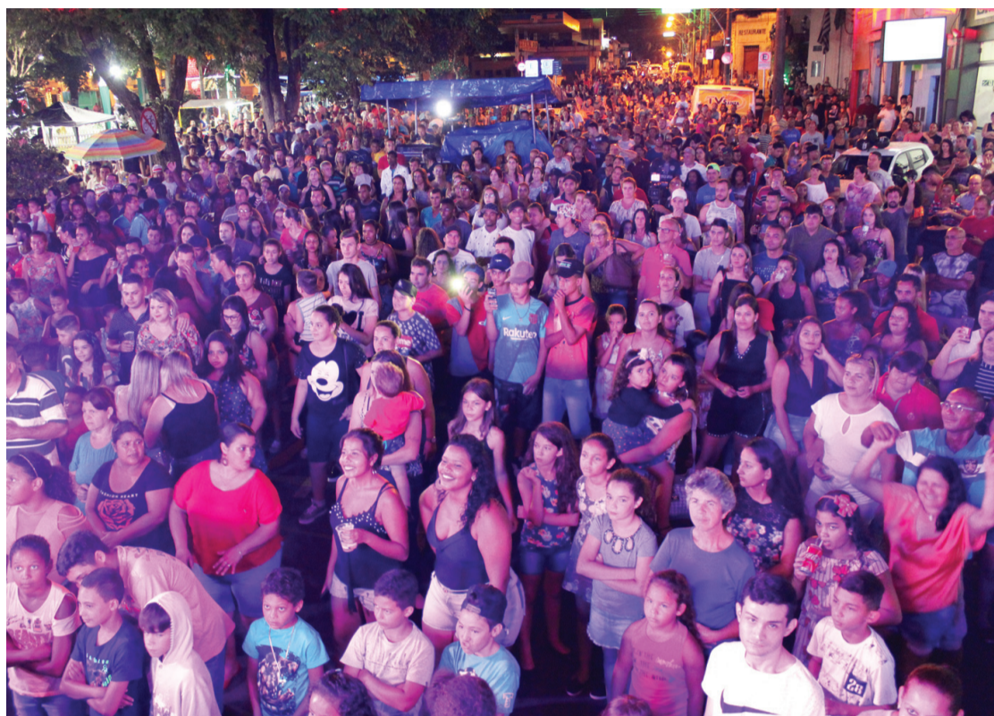
Público assiste show no sorteio do ano passado

a promoção de forma digital em que o consumidor recebe a seladinha na loja, faz o cadastro inicial e preenche através do site.