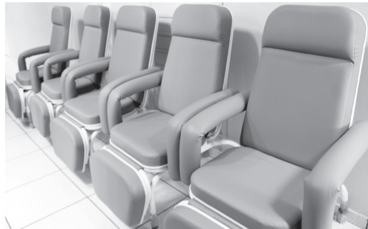
Poltronas recebidas através de recursos federais

Com os novos equipamentos deverá ser montada uma dala para a realização da triagem, desta forma recém-nascidos diagnosticados com algum tipo de problema auditivo poderão realizar o exame na própria Santa Casa, não tendo mais de ser transferidos para outras cidades.