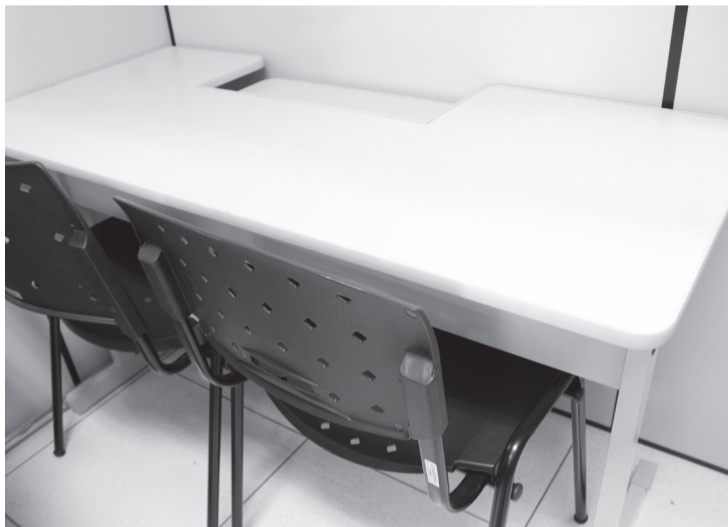
Setores da Santa Casa receberão móveis novos

Os equipamentos, móveis e demais itens hospitalares como arco cirúrgico, ar condicionado, mesas, poltronas, maca, computadores, e cadeiras são provenientes de convênios junto ao Ministério da Saúde resultados de emendas parlamentares e solicitações apresentadas em 2018. Alguns dos equipamentos já chegaram e foram alocados nos setores de maior necessidade, outros devem chegar nos próximos dias.