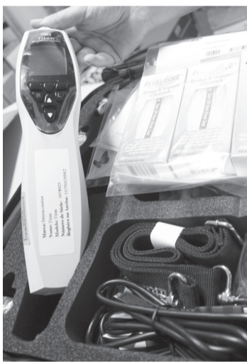
Aparelho que será utilizado na triagem auditiva neonatal

de R$ 100 mil é do deputado Antonio Carlos Mendes Thame (PV) a outra de R$ 299,9 mil foi encaminhada pelo deputado Arlindo Chinaglia (PT).