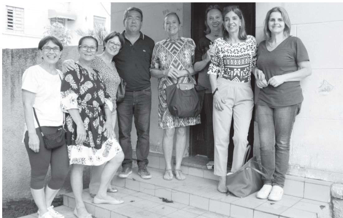
Movimento Acorda Santa Cruz no local de instalação do brechó

O brechó já funcionou dentro do hospital há algum tempo e atualmente estava em um prédio próximo ao hospital. "Estamos muito felizes em retornar para nossa casa e poderemos realizar o trabalho voluntário para a entidade", disse uma das integrantes do Acorda Santa