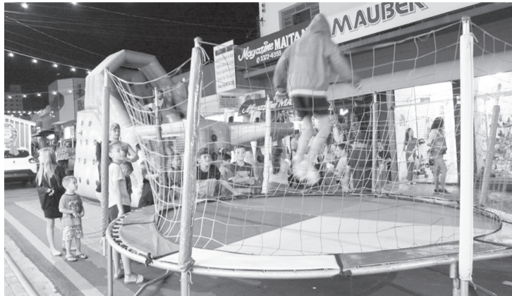
Crianças aproveitam os brinquedos instalados próximos a Casinha