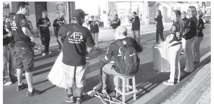
Apresentação da Percussão do CAPS

pai Noel que está em sua segunda edição e ficará nas ruas do comércio durante dez dias no período da noite. São realizados sorteios de brindes todas as noites com a participação das lojas localizadas em determinado quarteirão onde acontecem as atividades, além de brinquedos para as crianças e algodão doce. Além do bom velhinho que recebe as crianças na casinha outros dois papais noéis percorrem as ruas fazendo a alegria das crianças e adultos. No primeiro dia a atração foi o cantor Vinicius Viol e Percussão do CAPS. No dia 10, se apresentou a percussão do Centro Cultural Special Dog. Na quarta-feira (11) a Fanfarrinha da Escola Municipal Arnaldo Moraes Ribeiro se apresentaria, mas devido a chuva foi adiado. O Balé Municipal foi atração na quinta-feira (12). Ontem (13) foi realizada uma Parada de Natal pelo Centro Cultural Special Dog na rua Conselheiro Dantas. Já na próxima segunda-feira (16) Extre-