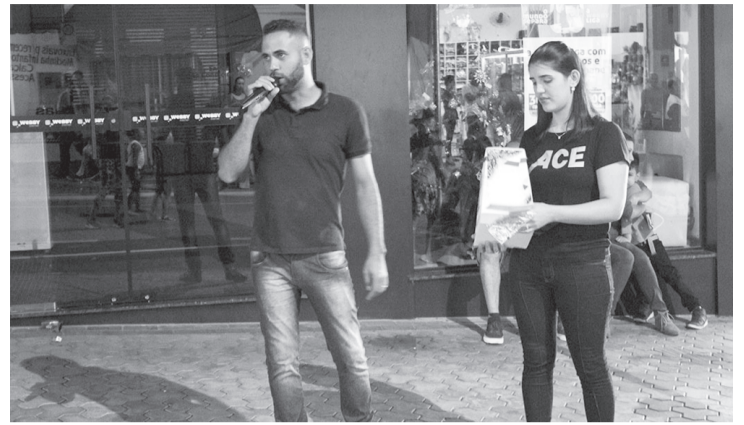
Sorteio de brindes realizado onde acontecem as atividades