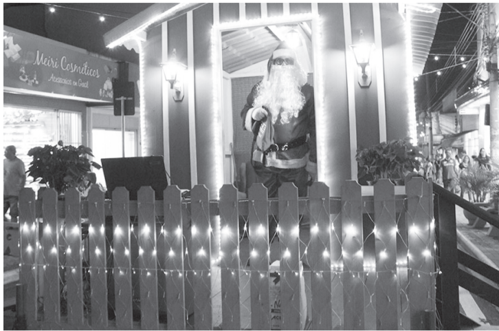
Papai Noel recebe as crianças em sua casinha móvel