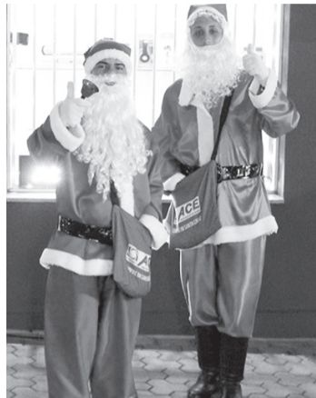
Papais noéis fazem a diversão dos consumidores nas ruas

Com o intuito de atrair ainda mais consumidores às ruas, a ACE (Associação Comercial e Empresarial) de Santa Cruz do Rio Pardo promove uma programação especial para a Casinha Móvel do Pa-