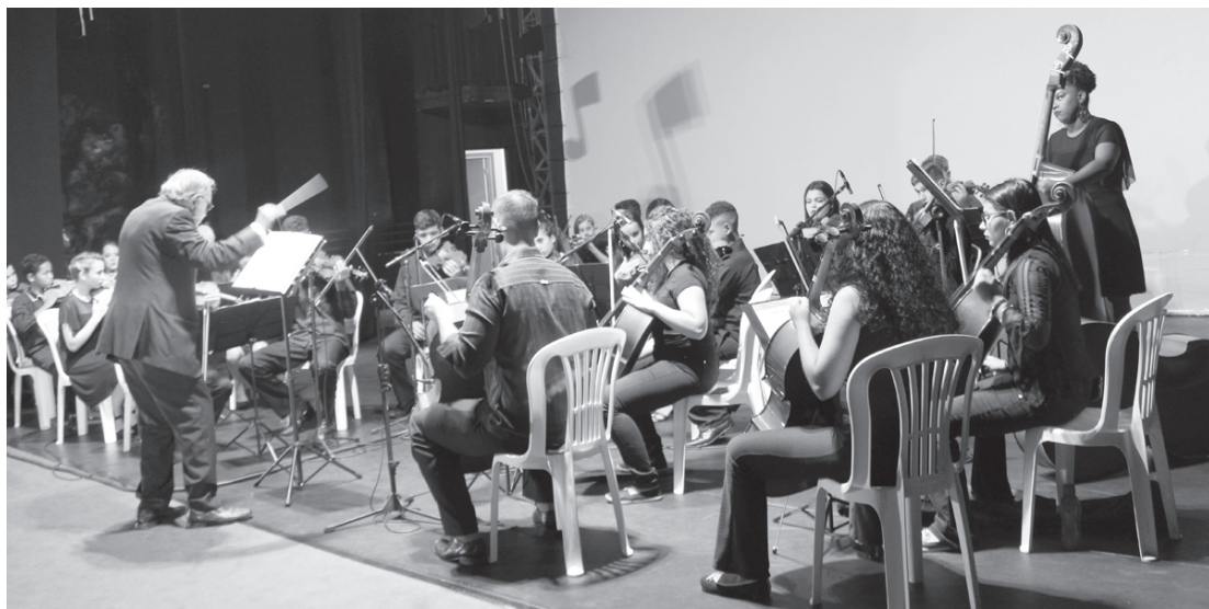
Concerto realizado no ano passado na Semana Mario Nelli de Música

Este é o quarto ano que a orquestra participa da