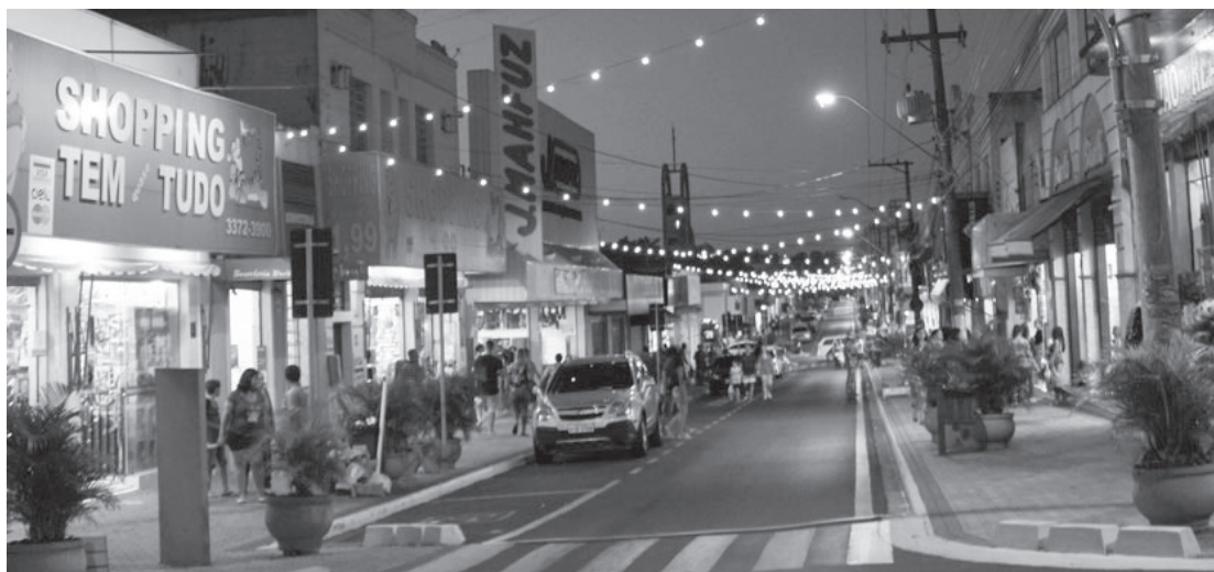
Iluminação natalina das ruas centrais será acesa neste sábado

A Promoção iniciou em 18 de novembro e segue até o dia 26 de novembro. O sorteio dos prêmios citados acima e mais dez vale compras será no dia 27 de novembro, às 20h30,