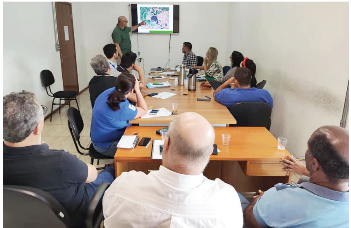
Já a tarde, os biólogos apresentaram o trabalho realizado e o que ainda há de ser feito para o combate aos carrapatos, bem como cada ação destinada às Secretarias