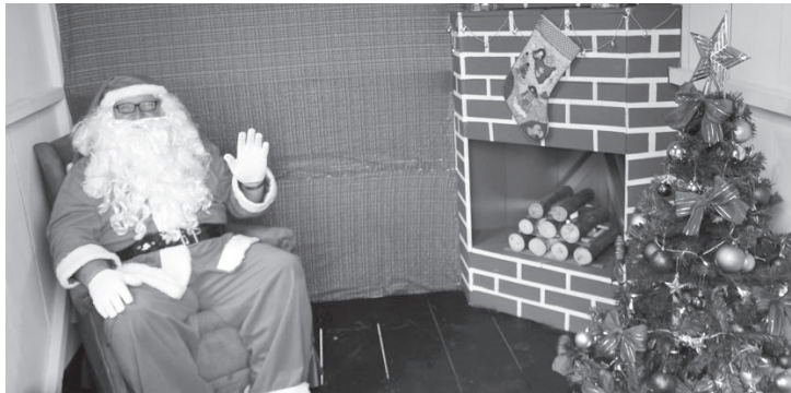
Papai Noel pronto para receber as crianças na sua casinha móvel

Na oportunidade também serão acesas as luzes que enfeitam o comércio da cidade. Neste ano o número de lâmpadas foi ampliado. A ACE disponibiliza a mão de obra e a prefeitura as lâmpadas para iluminação natalina.