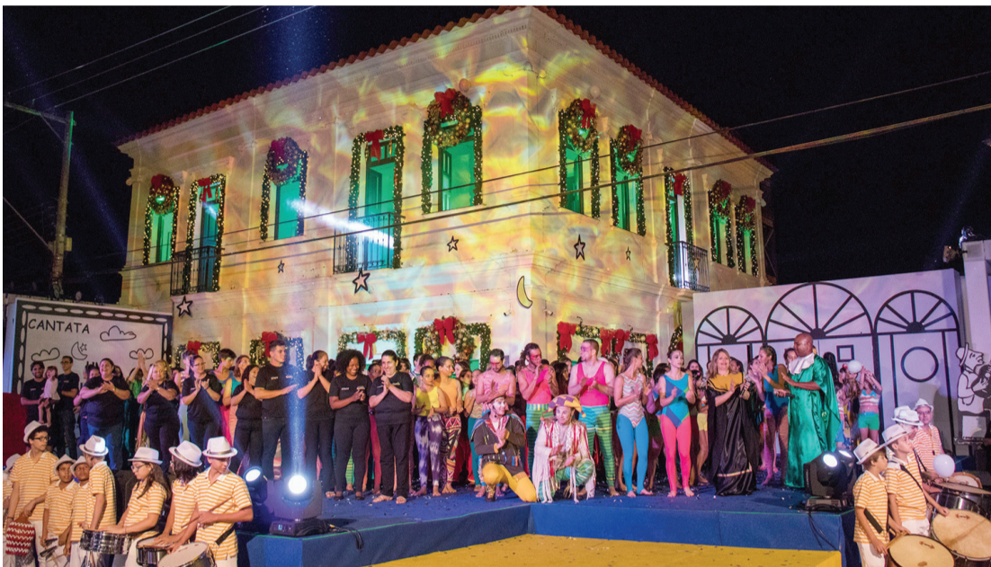
Na foto, momento de uma das atrações realizadas em edições anteriores

Os alunos de canto coral infanto-juvenil 1 e alunos de artes circenses de idades entre 06 e 09 anos realizam a