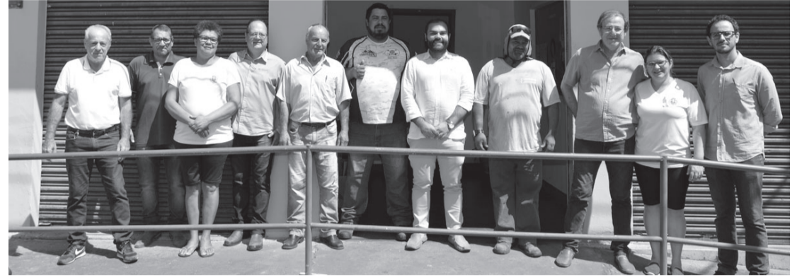
Subprefeito foi apresentado aos secretários

nheço a mãe dele, ela foi enfermeira da Santa Casa, tem excelentes referências, mora em Sodrélia, sendo assim, conhece todos e as necessidades do distrito, vai fazer um bom trabalho e atender os moradores”.