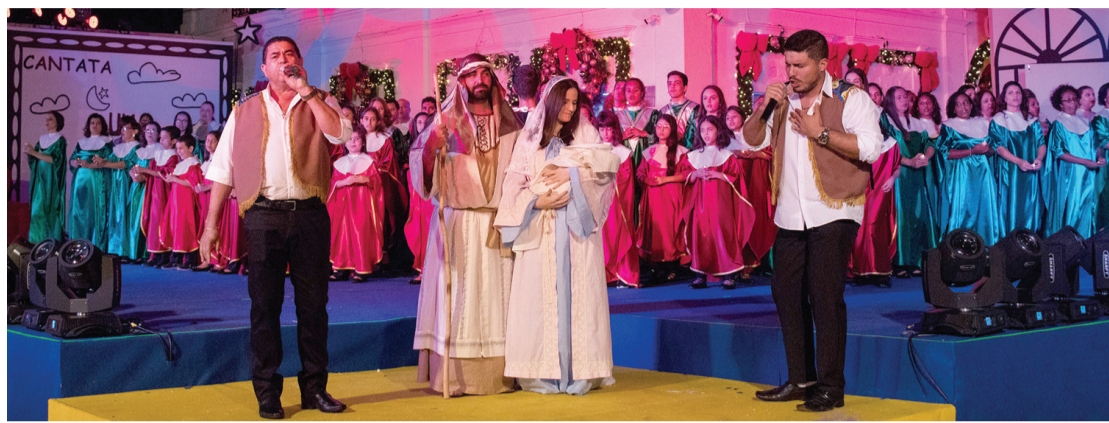
As apresentações natalinas dos alunos atraindo milhares de pessoas todos os anos

encenação de musicais natalinos. As apresentações acontecem em Teatro fechado. Hoje (24), às 20h30, no Palácio da Cultura Umberto Magnani Neto, com entrada gratuita.