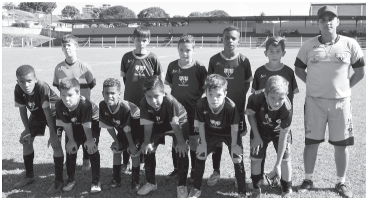
Equipe do sub 11 no Campeonato Regional de Ourinhos