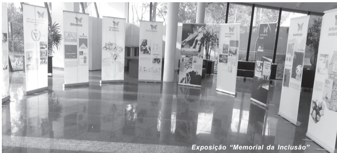
Exposição “Memorial da Inclusão”

Com a abertura da exposição “Memorial da Inclusão” no prédio da câmara de vereadores de Santa Cruz do Rio Pardo, teve início nesta segunda-feira (26) a 2ª Semana Municipal da Pessoa com Deficiência no município.