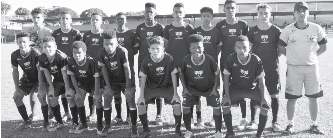
Meninos do sub 15 ganharam de goleada de Ourinhos B

Os times do projeto Talento Brasil conquistaram bons resultados no 1º Campeonato Regional Infantil de Ourinhos que teve a segunda rodada no sábado (24 de agosto), no Estádio Municipal Djalma Baía (Monstrinho).