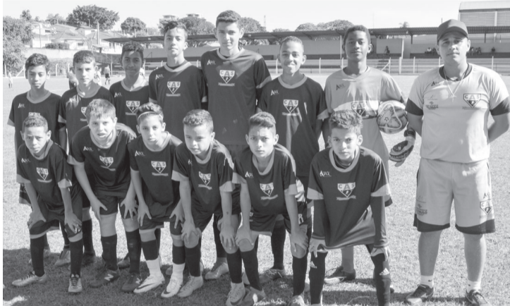
Time sub 13 ganhou por 3 a 0 de Ourinhos B

No próximo sábado (31 de agosto) tem mais uma rodada