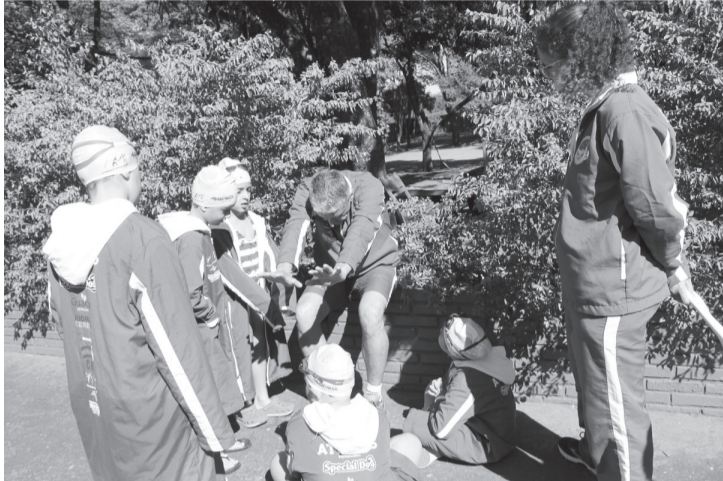
Atletas do Projeto Braçadas do Futuro, em Assis

Esta é a segunda competição da liga, a primeira aconteceu em no início de julho, em Ourinhos. A equipe Braçadas do Futuro contará com 20 atletas.