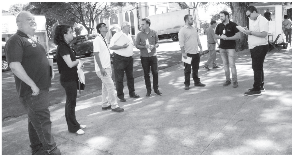
Representantes das empresas que poderão executar o projeto de Eficiência Energética