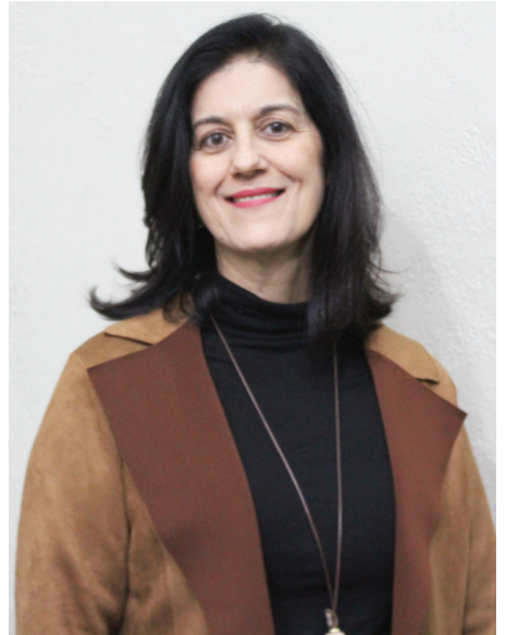
Mara destaca a importância da data para impulsionar as vendas

No dia de ontem e hoje, os consumidores têm horário de compras ampliado por conta do Dia dos Pais comemorado amanhã (11 de agosto). Ontem, o funcionamento foi até as 20 horas. Já hoje, as lojas ficarão abertas até as 17 horas.