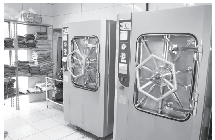
Objetivo da ação entre amigos é climatizar a Central de Materiais

compras do O Boticário (1º R$ 200,00, 2º R$ 150,00 e 3º R$ 100,00). O sorteio será no