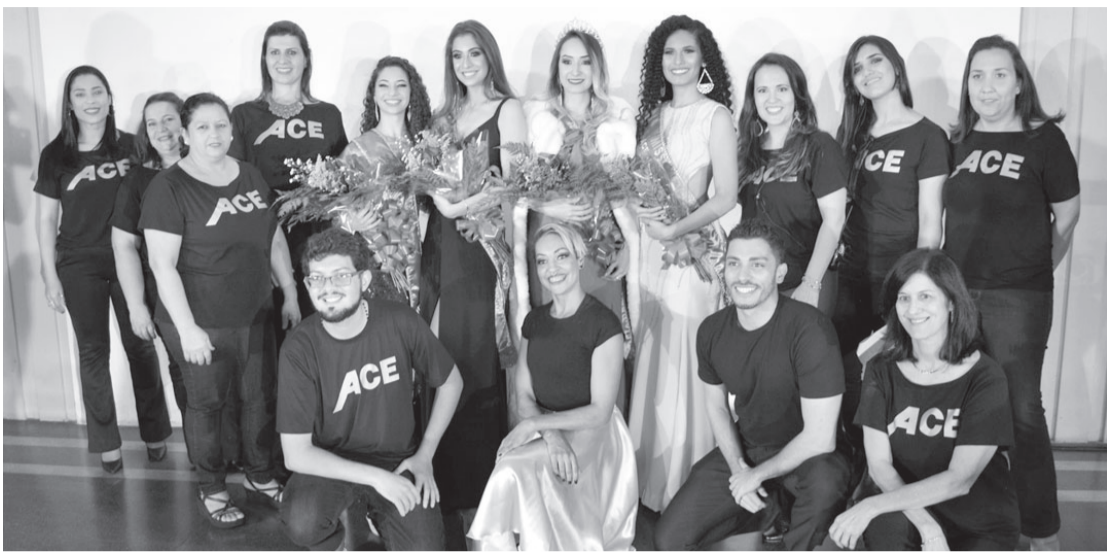
Equipe ACE com as vencedoras do concurso