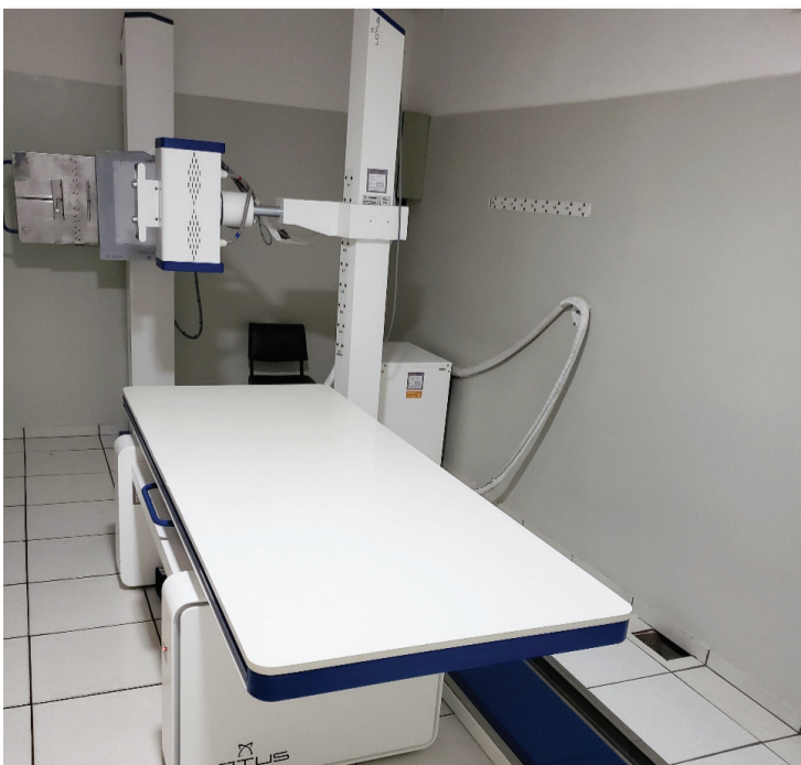
Raio X está entre os exames que podem ser realizados no SDI