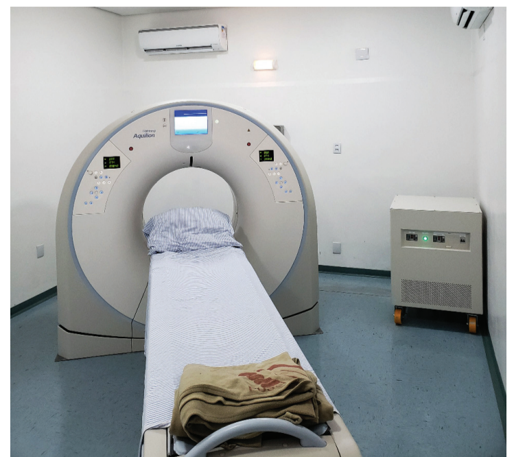
Tomografia computadorizada Multislice – 32 canais, tomógrafo de última geração