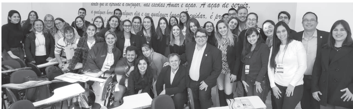
SANTA CRUZ DO RIO PARDO

muitos profissionais de Itapeva e região e estudantes do Curso de Farmácia em um evento com grandes nomes na educação farmacêutica no Brasil. Além disso, os projetos que serão implantados nos municípios que aderirem à proposta com certeza irão contribuir com a melhoria da saúde da população. (AI)