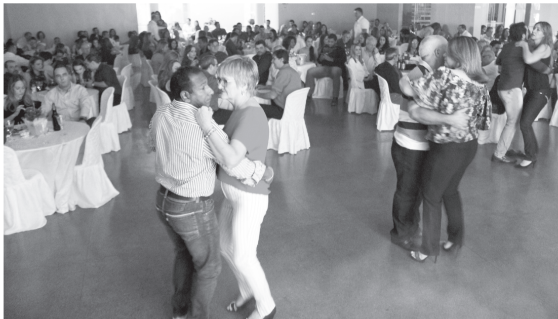
Noite Dançante realizada no ano passado na ACE

Realização: Ministério da Cidadania, Instituto CCR Vias e Cia Ouro Velho com apoio da Prefeitura Municipal de Santa Cruz do Rio Pardo