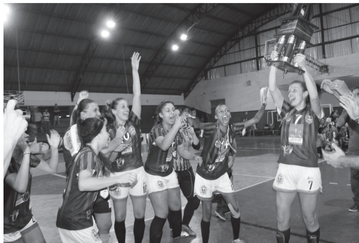
Atletas comemoram o título da competição