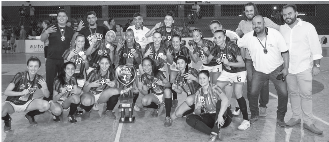
Futsal feminino é tetra campeão na Copa Record de Futsal

Com a vitória, Santa Cruz conquistou o seu quarto título da Copa Record, e no próximo dia 13 de junho, vai até a cidade de Salto, enfrentar a equipe local, pelo título da Supercopa dos Campeões. A equipe busca o tri campeonato nesta competição.