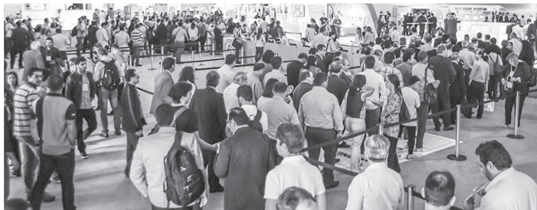
Feira Fispal deve reunir 470 expositores neste ano

Os visitantes conhecerão todas as tendências do setor, além de encontrar mais de 470 expositores com soluções em produtos, serviços, equipamentos, embalagens, ingredientes, alimentos, bebidas, e ainda poderão participar de diversas