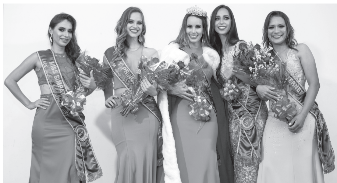
Ganhadoras do Miss Comerciária no ano passado

Os principais objetivos do concurso são promover a cultura e a beleza da mulher comerciária e valorizar os profissionais, motivando e ele-