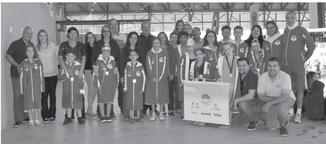
Pais, alunos e comissão técnica do Braçadas do Futuro, em competição em Bauru