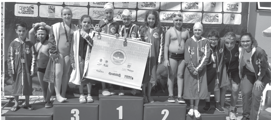
Medalhistas na competição realizada em Bauru