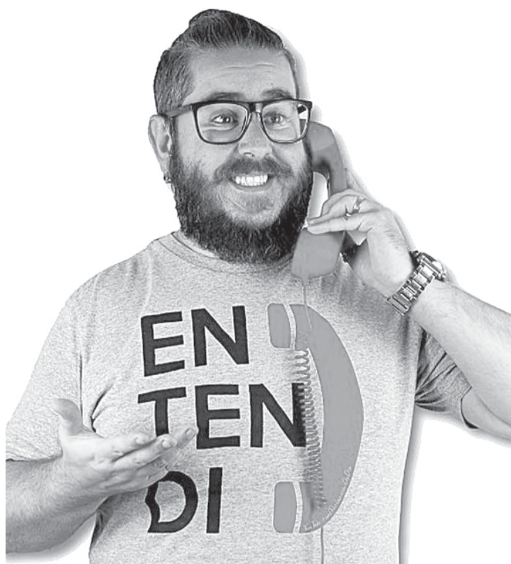
Artista ficou famoso por fazer reclamações do dia a dia

Durante o stand up, as situações vividas nos vídeos são adaptadas para o públi-