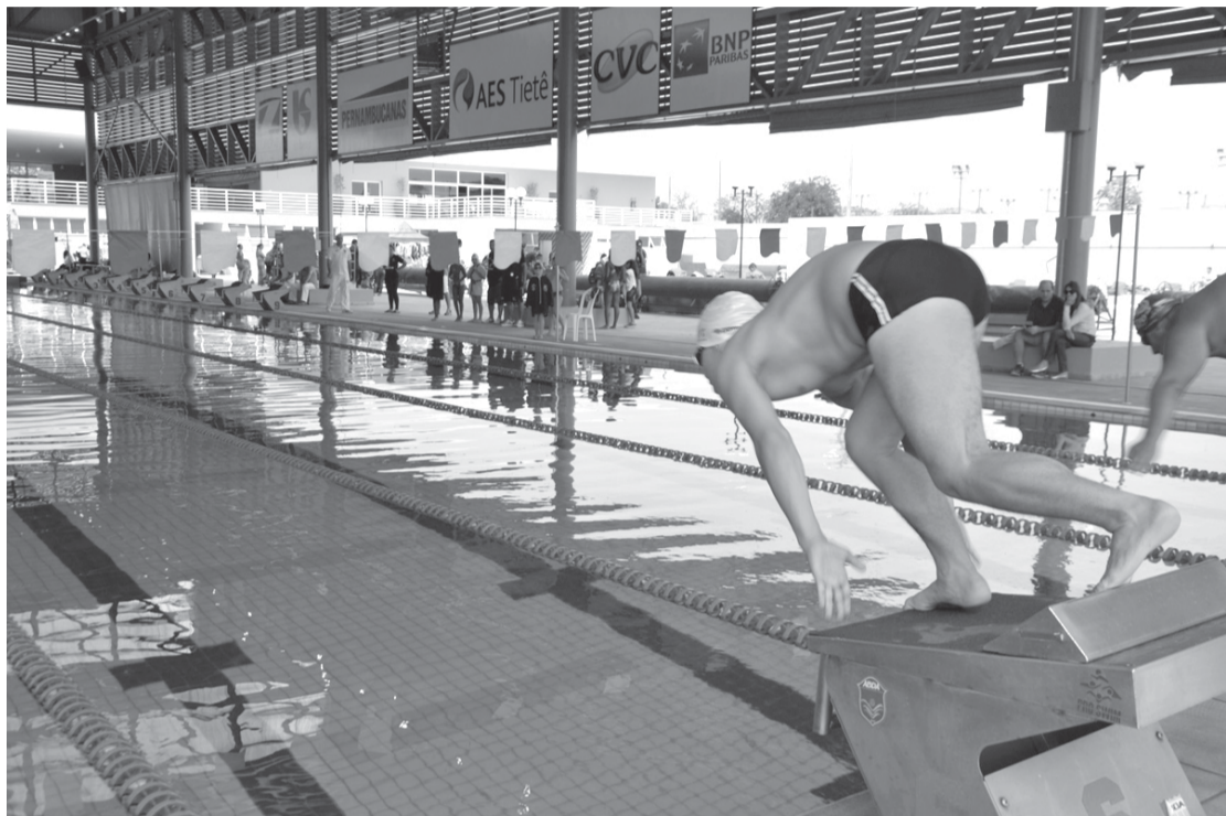
Competição contou com a participação de mais de 280 atletas de cidades do Estado de São Paulo