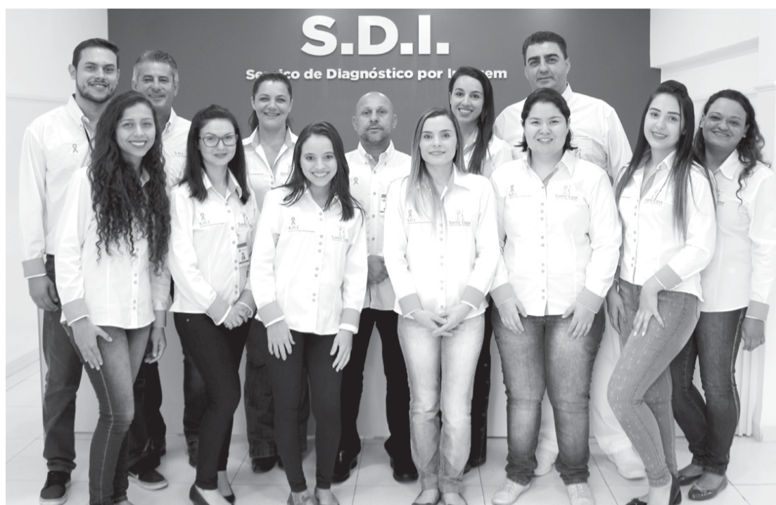
Equipe está pronta para mutirão de prevenção da saúde da mulher

O câncer de mama está entre os tipos da doença que mais acometem mulheres em todo o mundo e no Brasil – algo em torno de 25% do público feminino – perdendo apenas para