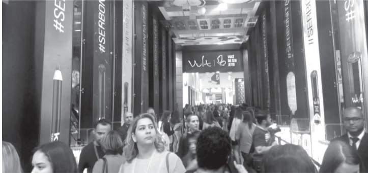
A Feira é visitada por milhares de profissionais da área da beleza