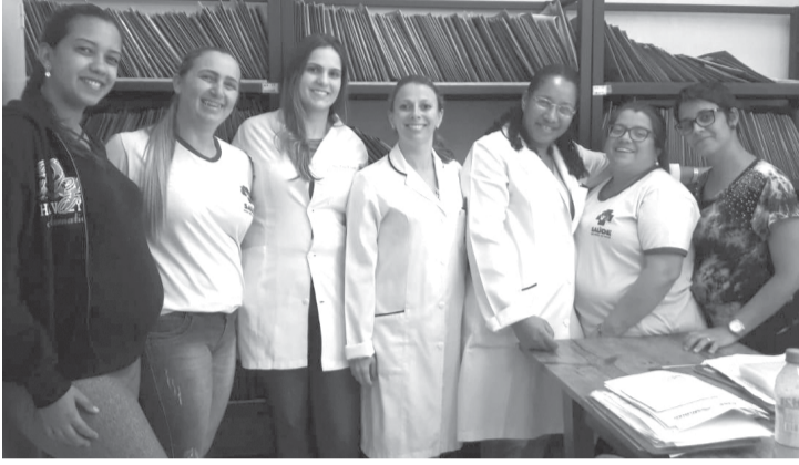
Equipe da "ESF Central"

dades da Saúde da Família foram avaliadas através do Programa Nacional de Melhoria de Acesso e da Quali-