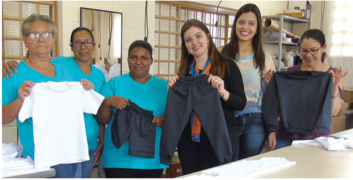
Matéria completa na página 5

Técnica regional do Fussesp visita projetos em São Pedro do Turvo e comprova sucesso obtido