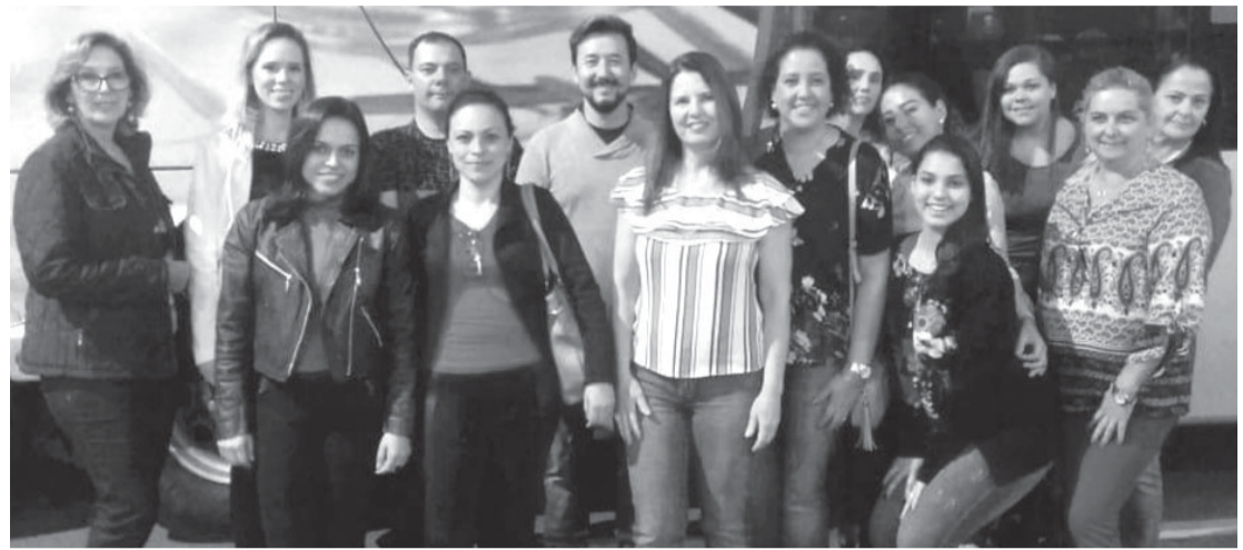
Grupo de profissionais de Santa Cruz que visitou a feira

As missões empresariais são promovidas durante todo o ano pelo Sebrae Aqui. Em julho, por exemplo, os artesãos