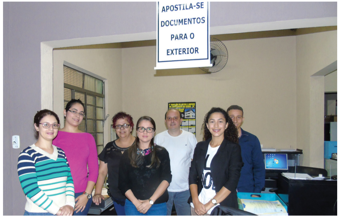
Mais detalhes na página 6 desta edição

Cartório de Registro Civil muda de endereço para melhor atender