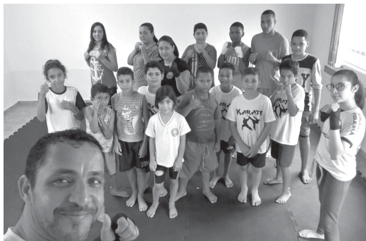
O professor com a turma da tarde de sexta-feira