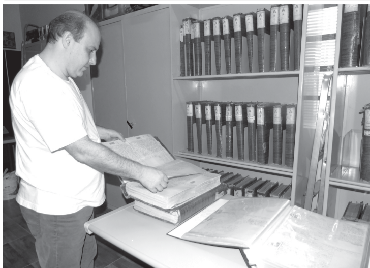
Mesmo digitalizados, Marcelo mantém os arquivos em livros