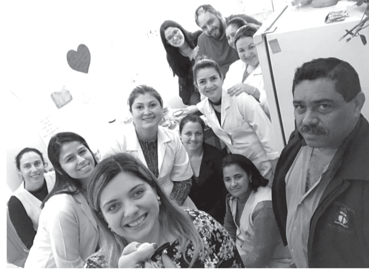
Equipe da "ESF Tino Neves"