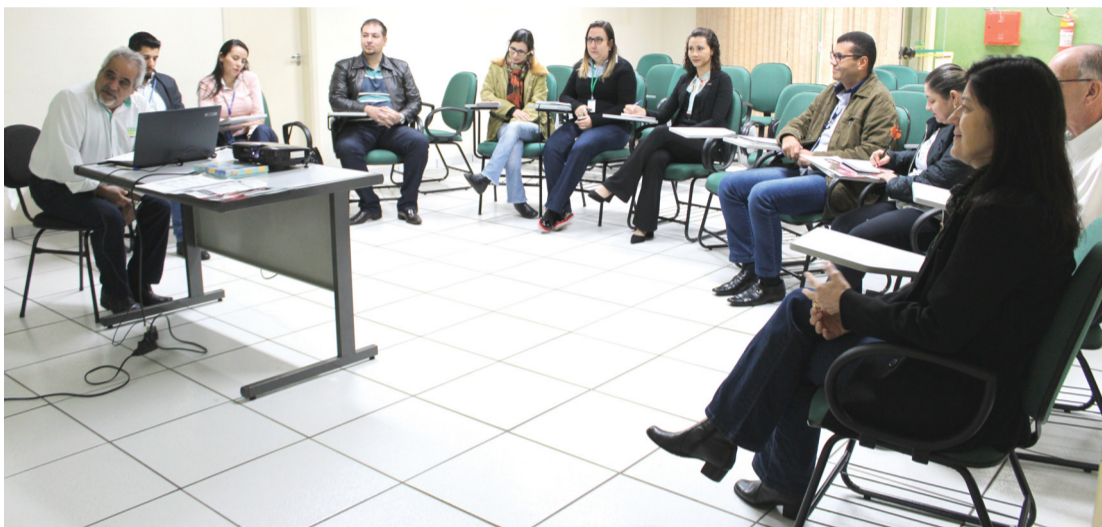
Representantes das entidades integrantes do Ativa Santa Cruz em reunião no mês de agosto

Estão abertas até 21 de setembro, as inscrições para a qualificação profissional vendedor. Os interessados podem se inscrever na ACE, de segunda a sexta-feira, das 8 horas às 18 horas. É necessário apresentar RG, CPF e histórico escolar.