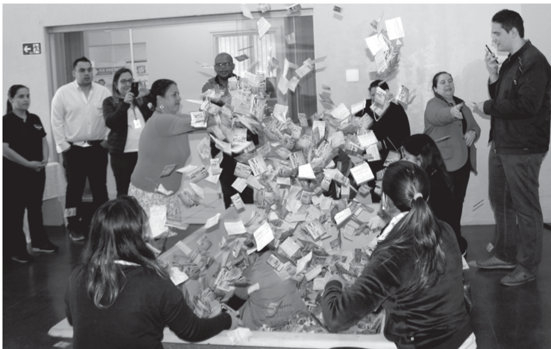
Mais de 50 mil cupons foram distribuídos nas lojas participantes da promoção