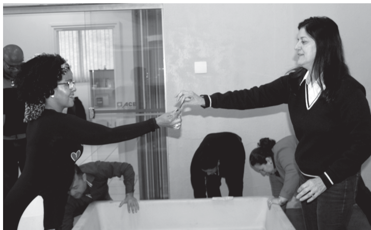
Consumidora sorteou um dos cupons garantindo credibilidade