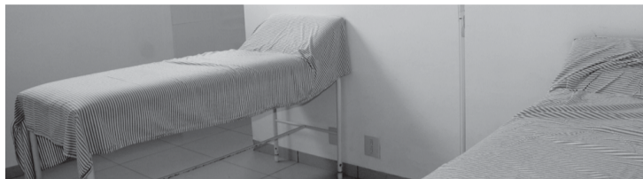
Sala de observação passou por melhorias. Na foto abaixo, banheiros com acessibilidade foram construídos

As melhorias foram executadas com recursos originados de fontes como as penas pecuniárias, que prevê a apresentação de projetos ao Judiciário que disponibiliza a verba proveniente de valores pagos com o cumprimento de penalidades alternativas. Esta é a quarta vez que a Santa Casa utiliza este tipo de recurso. Através deste projeto