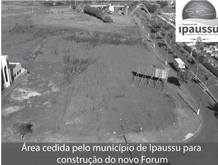
Área cedida pelo município de Ipaussu para construção do novo Forum