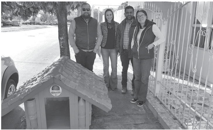
Aninha e equipe no momento da distribuição das casinhas pet

“Vem aí a maior festa da região, não a maior, mas a mais aconchegante”, brincou o prefeito. A festa de Ipaussu realmente tem se tornado uma das maiores festas da região, com grandes nomes como foi o ano passado e esse ano, o prefeito juntamente com a comissão