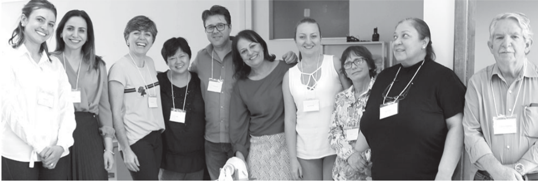
Médicos participam de Curso de Reanimação Neonatal

Aconteceu na Santa Casa de Misericórdia de Santa Cruz do Rio Pardo, entre os dias 28 e 30 de julho, o Curso de Reanimação Neonatal da Sociedade Paulista de Pediatria.