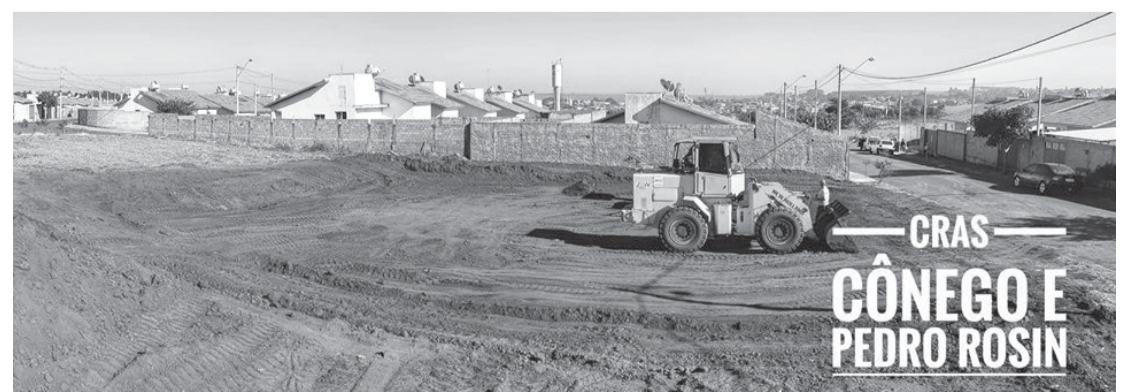
CRAS CÔNEGO E PEDRO ROSIN