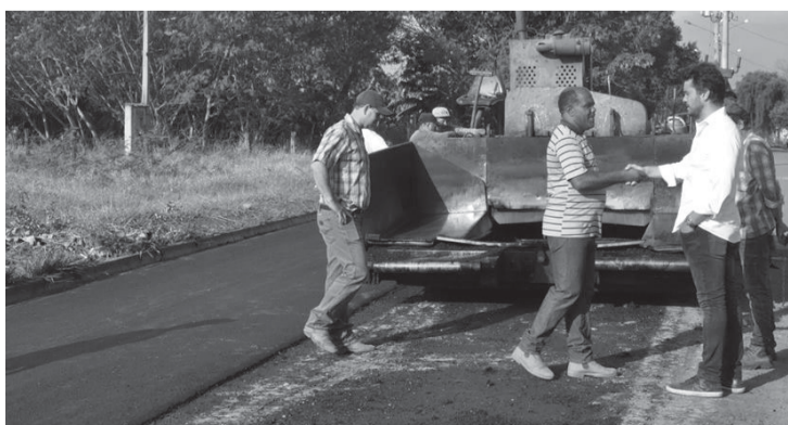
Recape e asfalto estão sendo feitos em várias ruas

Também será feita a recuperação das vias e pintura viária nas ruas do município. “Estamos inclusive comprando um aparelho, no valor de R$ 30 mil, para fazer essa pintura que vai beneficiar o município de uma forma mais rápida e econômica porque gasta menos tinta também”, concluiu Serginho.