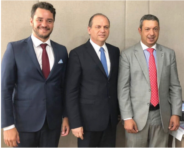
Prefeito Serginho, ministro Ricardo Barros e deputado Ricardo Izar

“Era um valor não vínhamos recebendo desde a implantação de algumas bases e outra parte dele tínhamos perdido mas, agora conseguimos reconquistar junto com a qualificação de algumas outras bases, o que diminui um pouco a contrapartida dos municípios (60%) para poder