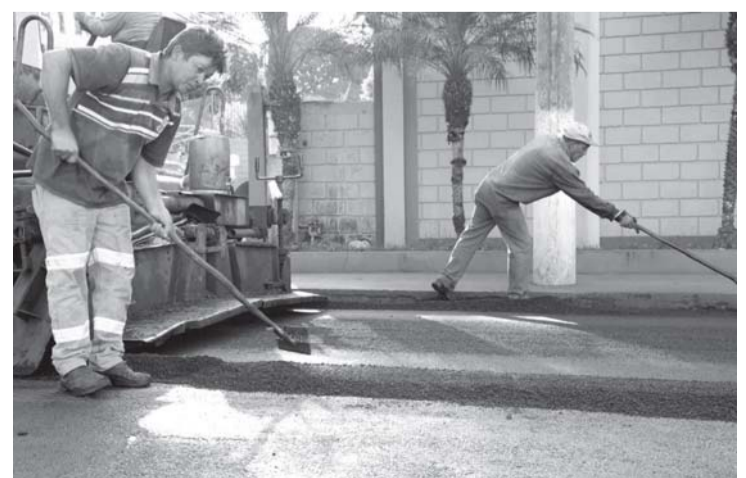
...que é visível a todos que transitam pelo local