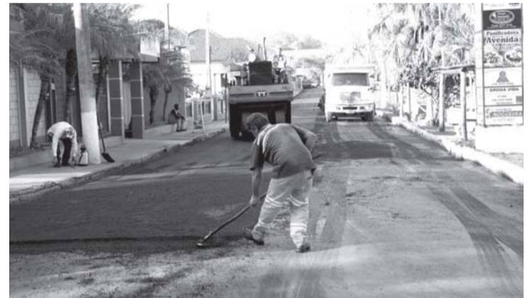
Várias ruas estão recebendo asfalto novo