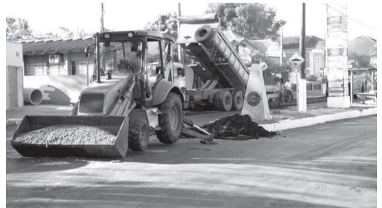
Maquinários estão trabalhando por todos os lados