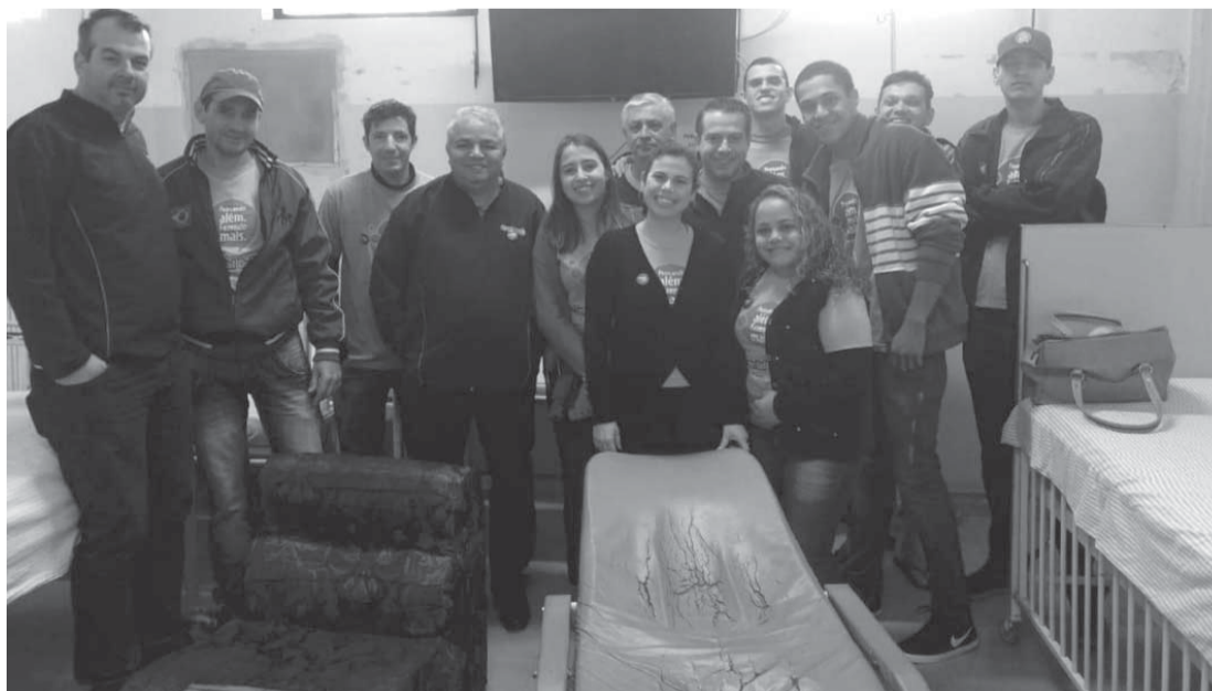
Uma das equipes vai restaurar móveis da pediatria

N.R.: A redação não se responsabiliza pelos artigos e conceitos assinados, tão pouco os endossa, pois representam a opinião pessoal dos autores.