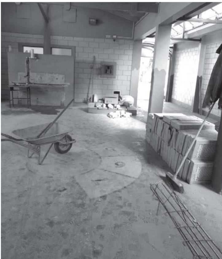
Reforma e acessibilidade do banheiro da EMEI Maud Wilfer Dias