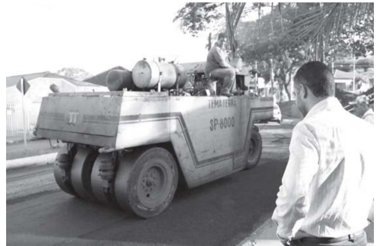
...para conferir a qualidade no trabalho...