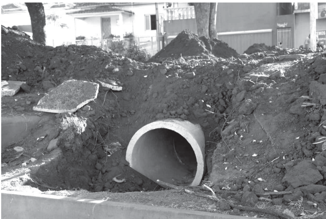
Galerias e escoamento de águas na Praça José Teodoro

tor importante nisso porque tem aprovado todos os projetos que a gente tem levado ao conhecimento deles, vendo a necessidade de cada um. Sempre quando a gente leva algum projeto polêmico para a Câmara que vai dar um pouco mais de complexidade de entendimento, a gente procura se reunir, ou na Câmara ou na Prefeitura, mas essa reunião foi mais uma possibilidade de apresentar todo o trabalho que a gente vem fazendo pelo município e mostrando pra eles que a gente só consegue ter sucesso se trabalhar em parceria. Estava lá o presidente da Câmara e todos os vereadores não só de oposição mas da Base também e eu achei muito frutífera porque eles puderam entender como a prefeitura está rodando, como a gente quer um trabalho sério e, ao mesmo tempo, escutando as demandas deles que tem muitas dúvidas, tem as indicações que a gente tem procurado atender dentro do respeito ao orçamento do município então, é uma transparência que a gente quer levar pra Câmara pra respeitar a Constituição que diz que os Poderes são distintos porem, harmônicos entre si, essa aproximação, essa conversa, é importante para que a gente trabalhe forte, trabalhe unido”.