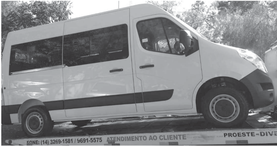
A nova Van chegou na quarta-feira e foi adquirida pelo valor de R$ 138 mil

É um problema muito sério nas imediações da Praça José Teodoro em dias de chuva, pois as galerias não estão comportando as águas que descem o que ocasiona muitas vezes em alagamento. “A população vem sofrendo muito, inclusive com águas dentro de residências, de lojas, que é uma rua central. Estamos aumentando a galeria, aumentando a polegada e passando por dentro da praça para poder dar vazão a água