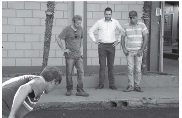
O prefeito sempre acompanhando de perto...