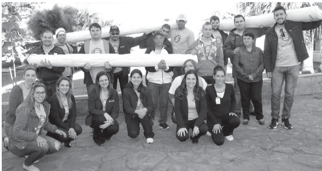
Equipe cinza entregou o tecido para confecção de lençol

O grupo cinza, composto por 54 integrantes escolheu a Santa Casa para doação dos 400 metros de tecido, com investimento de R$ 4.872. O material será suficiente para a confecção de 200 lençóis. A produção será realizada pela costureira do hospital. Para conquistar o recurso, os voluntários promoveram ações como sorteios de prêmios.