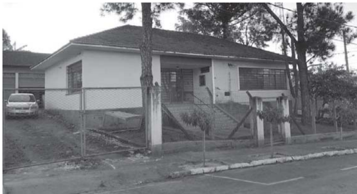
Reforma da Casa da Agricultura

Com apenas 40 dias de implantação da OS, os resultados já poderão ser observados. A partir do dia 1º de agosto, será implantado o novo sistema de atendimento. “São as etapas de atendimento com respeito ao paciente, o que significa isso? Será atendido de acordo com o processo; primeiro do cadastro, que é a recepção, segundo passo é a classificação para ver se está em estado de emergência ou se pode esperar um pouco mais o atendimento, depois passa por uma pré-consulta com enfermeiro para fazer a triagem e o quarto passo é com o médico então, cada um será classificado com uma pulseira. Se o paciente tiver com risco imediato de perder a vida, vai receber uma pulseira vermelha de emergência; se for caso urgente e a condição de atendimento se agravar, recebe a pulseira laranja; o verde para pouco urgente que a pessoa pode es-