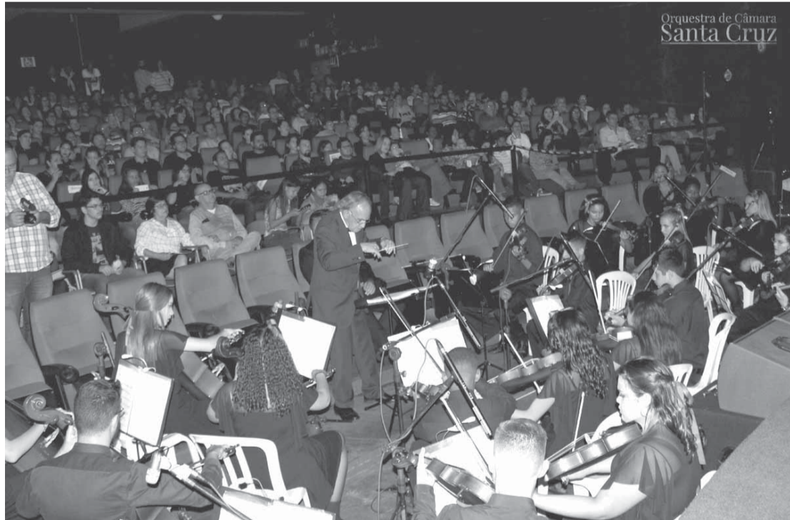
Concerto atraiu grande público ao Palácio da Cultura Orquestra de Câmara iniciou no sábado o Curto Circuito Musical