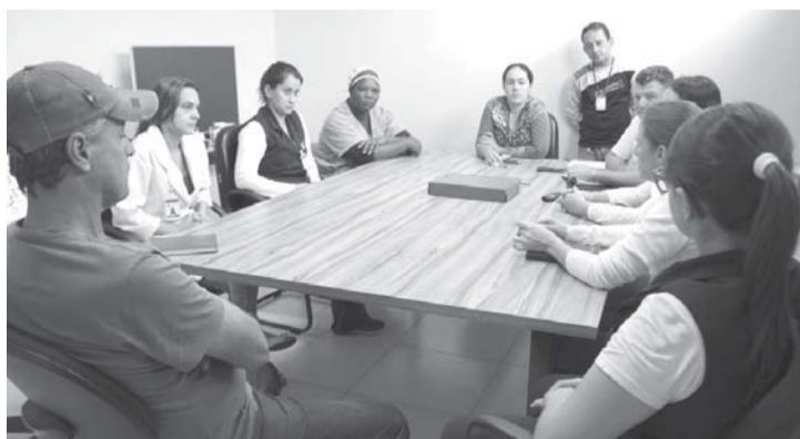
Reunião trata formas de prevenção dos acidentes de trabalho