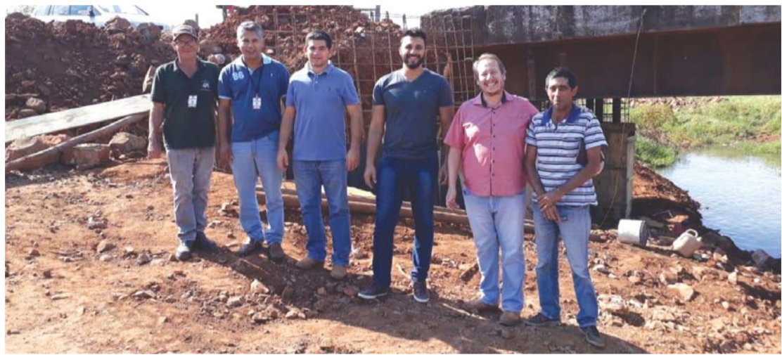
Matéria completa nesta edição