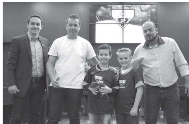
Alunos receberam os uniformes durante evento de lançamento

Além dos treinamentos, o projeto também conta com apoio de dois psicólogos aos