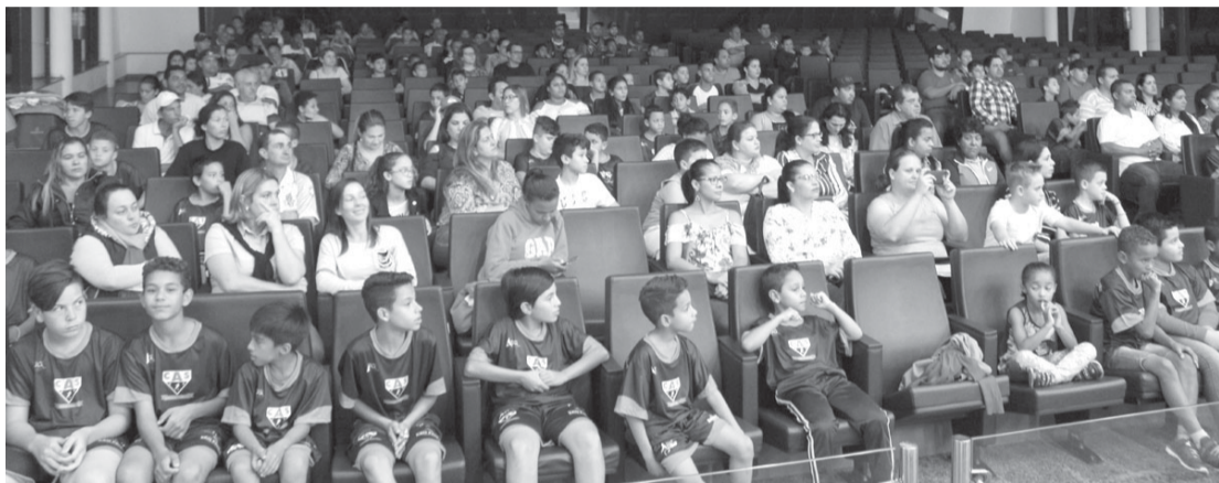
Alunos do projeto CAS Formando Talentos. Pais lotaram a Câmara para acompanhar a cerimônia