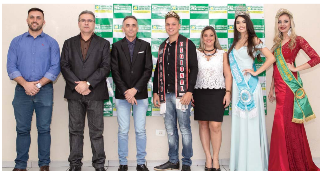
Jurados que elegeram a mais bela do comércio santa-cruzense