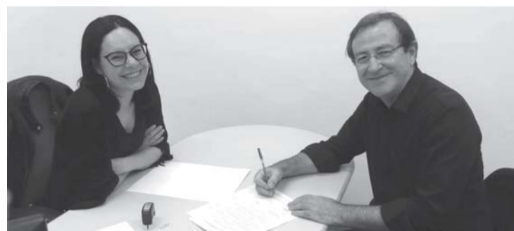
Prefeito assinando convênio da Sutaco

anos, em situação de vulnerabilidade, oferecendo cursos de formação cidadã e de qualificação profissional e em atividades de interesse social à comunidade.