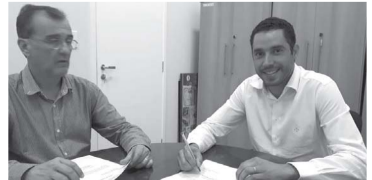
Momento da assinatura do convênio do ônibus