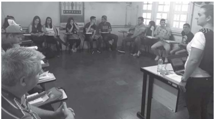
Programa Time do Emprego

Teve início na última semana o Programa Time do Emprego, que busca orientar o trabalhador na busca de um trabalho compatível com seus interesses, habilidades e qualificações profissionais.