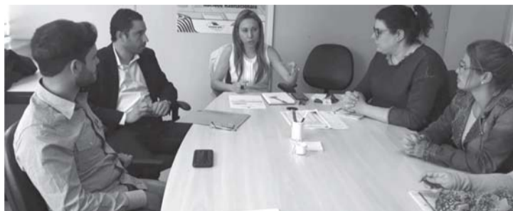
Reunião na Cidade Legal