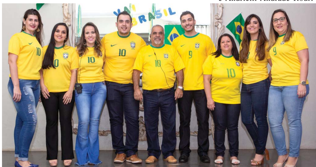
Equipe da ACE que promove o evento há oito anos