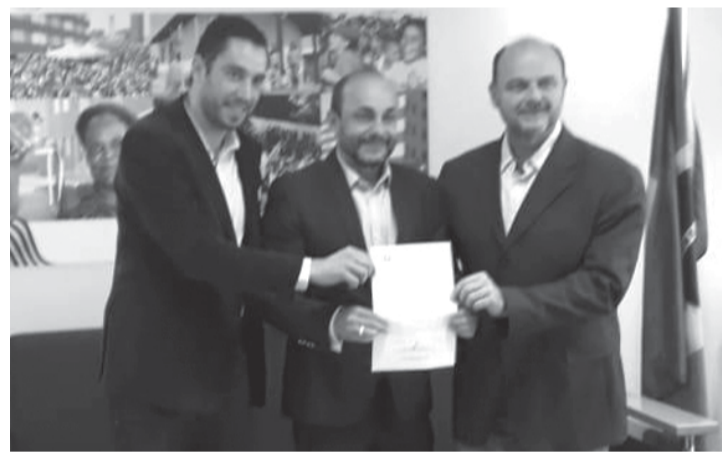
Momento da assinatura convênio da reforma da Praça

Outro convênio assinado, é no valor de R$ 150 mil que será utilizado para reforma e cobertura da quadra da Vila