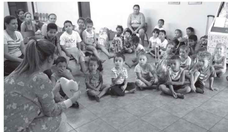
Crianças, do Centro Social, felizes após receber escovas de dente

Esta foi a primeira orientação, do ano, promovida pela odontopediatra. No ano passado, entre os espaços visitados, estão: Apae, Cantinho Mágico, Pequerrucho e Escola João e Maria.