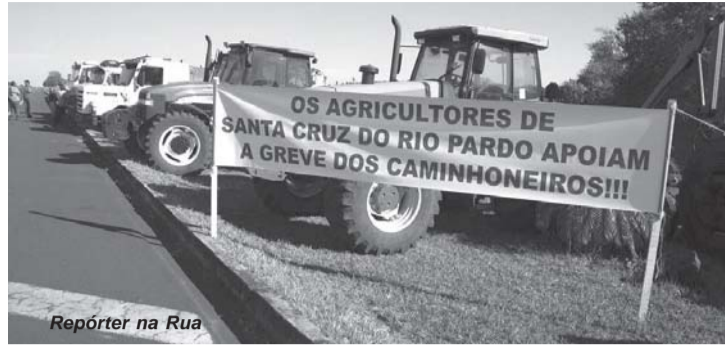
Repórter na Rua

Teve inclusive posto que aproveitando da situação, aumentou o valor do combustível o que culminou na intervenção do prefeito Otacílio Assis junto ao Procon que tomará as devidas providências. Supermercados também elevaram preços de diversas mercadorias, afetando ain-